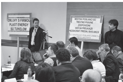
Aktivisti svoj nesúhlas prejavili na rokovaní transparentmi.