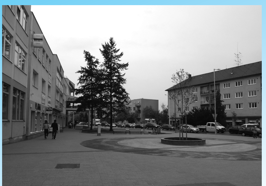
Priestranstvo pred Eurodomom dostalo už definitívnu podobu. Projekt Senica s novým námestím, ktorý je financovaný z eurofondov, pokračuje plynulým tempom.