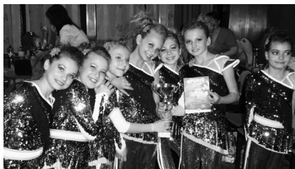
Detská veková kategória – 1. miesto disco dance skupina na pohárovej súťaži v Šali.

Tanečná skupina SCREM Senica, Mesto Senica a MsKS Senica si všetkých milovníkov tanečného umenia dovoľujú pozvať aj tento rok na Majstrovstvá Slovenska SE DANCE CUP 2011, ktoré sa budú konať 6. až 8. mája na zimnom štadióne v Senici. Tancovať sa bude od rána do neskorého večera v piatok až v nedeľu, a to v 46 tanečných disciplínach vo všetkých vekových kategóriách sa návštevníkom predvedie asi 1000 tanečníkov z celého Slovenska.