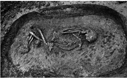
Jeden z nájdených hrobov, ktorý tisíce rokov ukryvala zem na Párovciach.

Rastúce kopy hliny a oveľa menšie kôpky črepín, pazúrikových nástrojov, kostí zvierat, mazanice, uhlíkov. A tak sme kopali a prehrabávali sa životom ľudí, ktorí tu bývali v drevených domoch, spávali na kožiach, varili v hlinených nádobách, zdobili sa korálikmi z keramiky a jantáru, lovili divé prasatá a jelene, vyrábali nástroje z kameňa, ozdoby z bronzu. Rozmýšľali sme, aké mali radosti, starosti, akou rečou rozprávali... Ako vlastne vyzerala krajina pre 50 tisíc rokov alebo pred 6 tisíc rokmi?