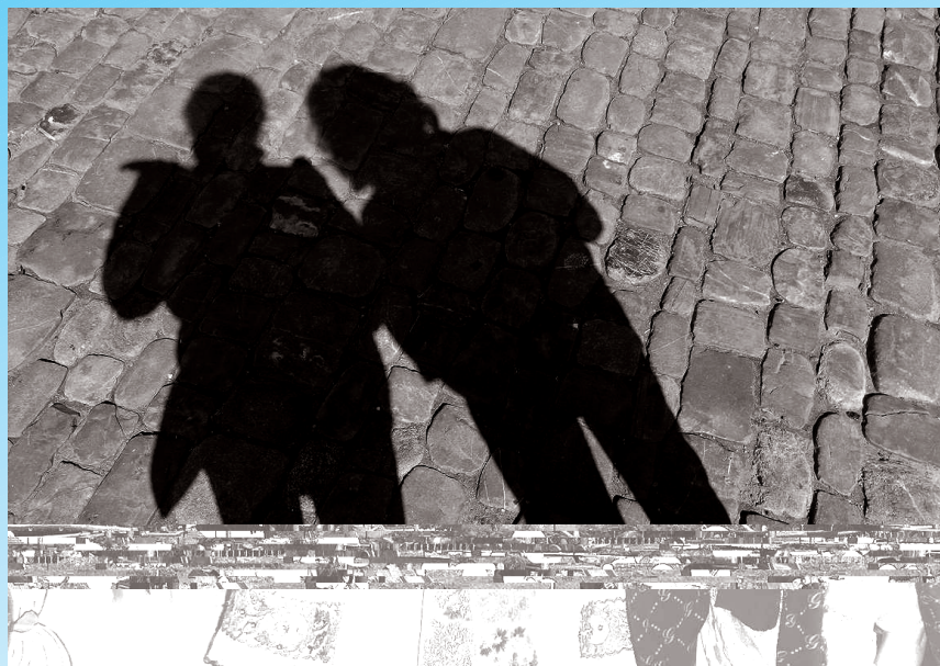
Tieäovä priateľstvá, fotografia ocenenä v sčéäai Mlad' pred objekt'vnom ä mlad' za objekt'vom.