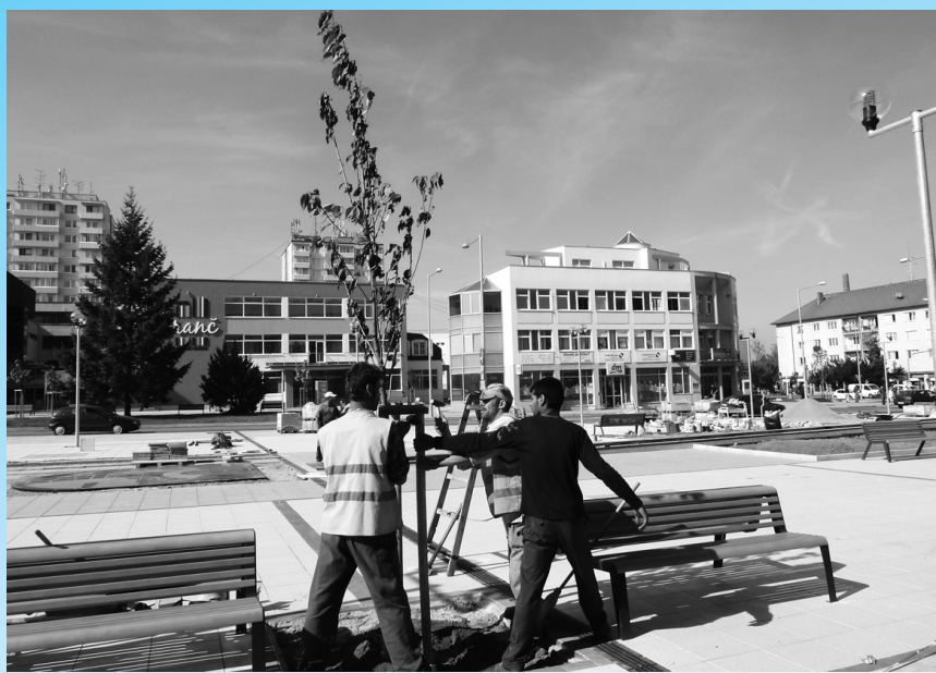
Námestie oslobodenia dostáva definitívne kontúry v zmysle projektu Senica s novým námestím. Firma Intersad Svätý Jur zasadila 28. septembra pomedzi parkové osvetlenie mladé sakury, ktoré budú skrášľovať celú plochu. Slávnostné odovzdanie plochy do užívania bude 11. novembra počas Martinského svetlonosenia. bar

V Deň konferencie predpoludním o 8. 30 hod. bude v Dome kultúry otvorená aj výstava ovocia a zeleniny Plody Záhoria , ktorá potrvá do 20. októbra. Pestovatelia z regiónu združení v Slovenskom zväze záhradkárov ponúknu na obdiv svoje najlepšie výpestky. Súčasťou bude aj súťaž v aranžovaní a predaj včelárskych produktov. bar