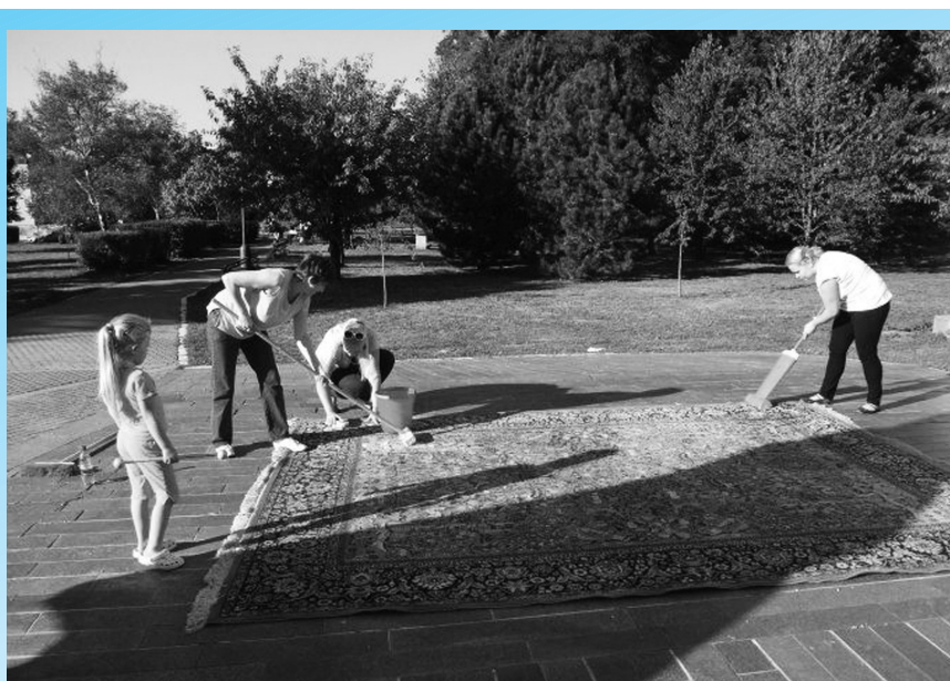
Dobrovoľníci sa snažili. Bolo nás 32 a niekoľko hodín sme umývali, drhli, čistili, natierali, utierali, nosili, skrátka robili všetko, čo bolo treba.