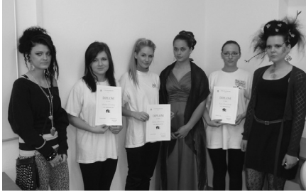
Tri najlepšie kaderničky s diplomami a ich modelky

Žiaci 3. ročníka odbor kaderník Strednej odbornej školy (SOŠ) Senica si 16. novembra porovnávali svoje zručnosti, nápady a fantáziu v účesovej tvorbe.