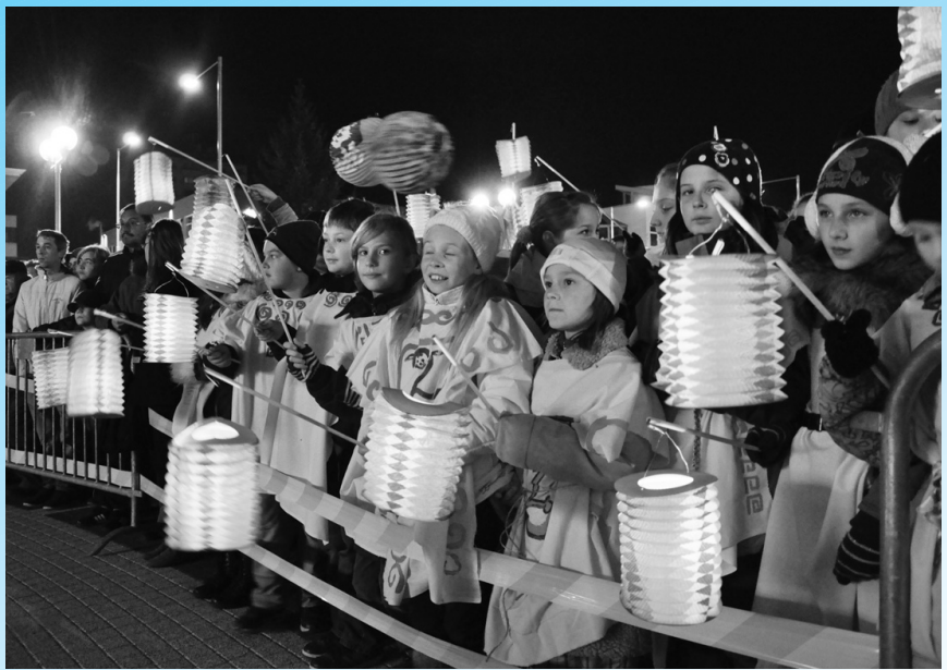
Stovky rozsvietených lampiónov priniesli na novučičké námestie najmladší obyvatelia mesta.