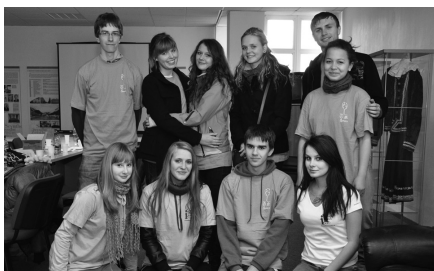
Časť študentských aktivistov

Pod týmto názvom prebieha v Senici až do 31. decembra 2011 verejná zbierka na obnovu sôch nachádzajúcich sa na Námestí oslobodenia pred rímsko-katolíckym kostolom. Sochy sú významnými umelecko-historickými pamiatkami nielen mesta, ale socha sv. Floriána je zapísaná aj v Ústrednom zozname Pamiatkového fondu SR – v registri nehnuteľných kultúrnych pamiatok.