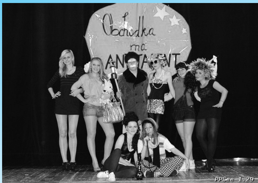
Imatrikulácie na Obchodnej akadémii boli významnou udalosťou pre študentov.

Dievčatá, začnite rozmýšľať o plesovej rube, chlapci, pozvite včas na ples svoje slečny alebo sa dohodnite rovno s celou