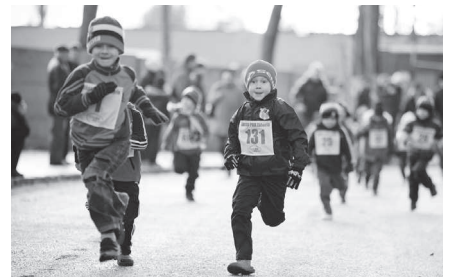
Verme, že s rovnakým nadšením ich uvidíme bežať aj v ďalších ročníkoch.