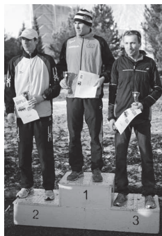
Víťazi hlavnej kategórie