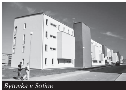
Bytovka v Sotine

Mojím cieľom je, aby mesto vytváralo tvorivé podmienky pre všetkých a v každej oblasti života, ktorú je možno dosiahnuť. Nikdy nebudeme historické turistické mesto s historickými budovami, ani supermoderné veľkomesto. Ale čo môžeme byť, je dobré miesto pre náš život. Môžeme mať kvalitné školy, dobré podmienky pre prácu a pracovné príležitosti, dobré obchody, služby, kvalitné a dostupné zdravotné a sociálne zabezpečenie, čisté a zdravé životné prostredie i kvalitnú infraštruktúru, príjemné kultúrne a priateľské stretnutia pre všetkých, bez rozdielu pohlavia, veku, náboženskej či inej príslušnosti, bezpečné bývanie s perspektívnou a dôstojnou existenciou.