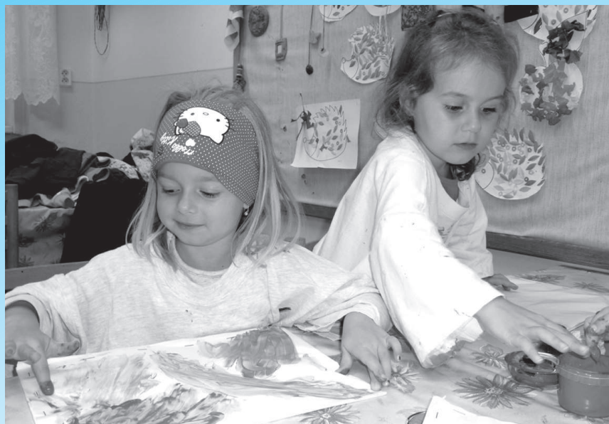
Budúci prváci sa prídu zapísať do škôl, aby získali nové vedomosti a rozvíjali svoj talent v záujmových krúžkoch. Ako tieto dievčatká v CVČ na krúžku výtvarnej výchovy.