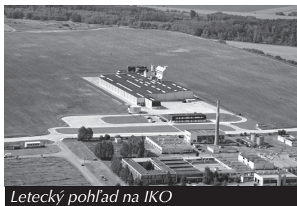
Letecký pohľad na IKO

Ekologický pohľad na každý projekt v meste je našou samozrejmovou povinnosťou k životnému prostrediu, ktorého ochrana patrí medzi naše priority. Výsadba a ochrana zelene, zlepšovanie životného prostredia bude našou každodennou súčasťou a filozofiou vo všetkých projektoch. Budeme pokračovať v budovaní ihrísk, športovísk, oddychových a relaxačných zón. Do týchto projektov, ktoré slúžia všetkým vekovým kategóriám chceme zapojiť čo najviac obchodných a neobchodných organizácií.