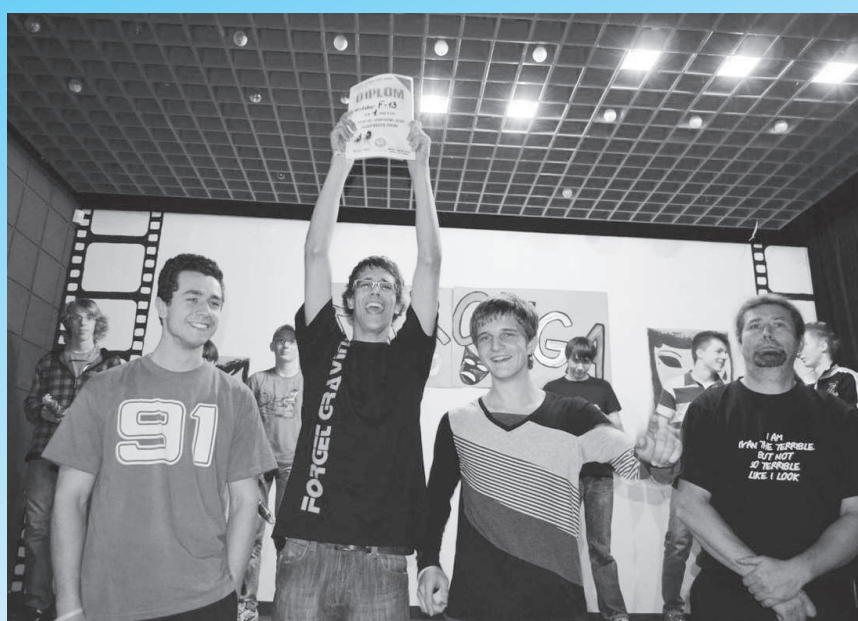
Radost víťazného družstva v Improlige.