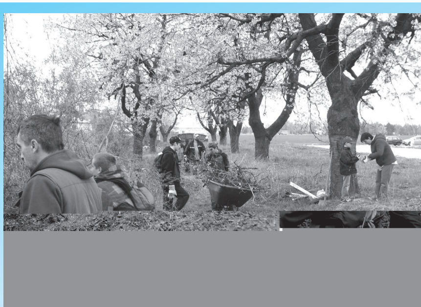
Zarastená a opustená čerešňová aleja sa rukami mnohých dobrovoľníkov začína premieňať na nádhernú oázu. Ak sa ich nájde viac budú práce rýchlejšie napredovať a tým skôr sa aleja stane vyhľadávaným miestom.