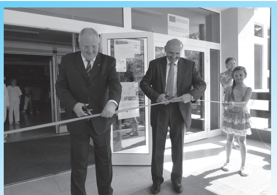
Minister školstva Dušan Čaplovič a primátor Senice Ľubomír Parížek odovzdali zrekonštruovanú školu do užívania.