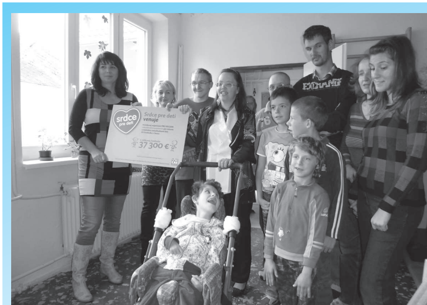
Klienti denného stacionára Svetluška v Kunove mali dôvod na radosť. Poďakovali za peniaze z Nadácie Pontis a nadačného fondu Srdce pre deti, ktoré umožnili dať ich budovu do vyhovujúceho stavu.