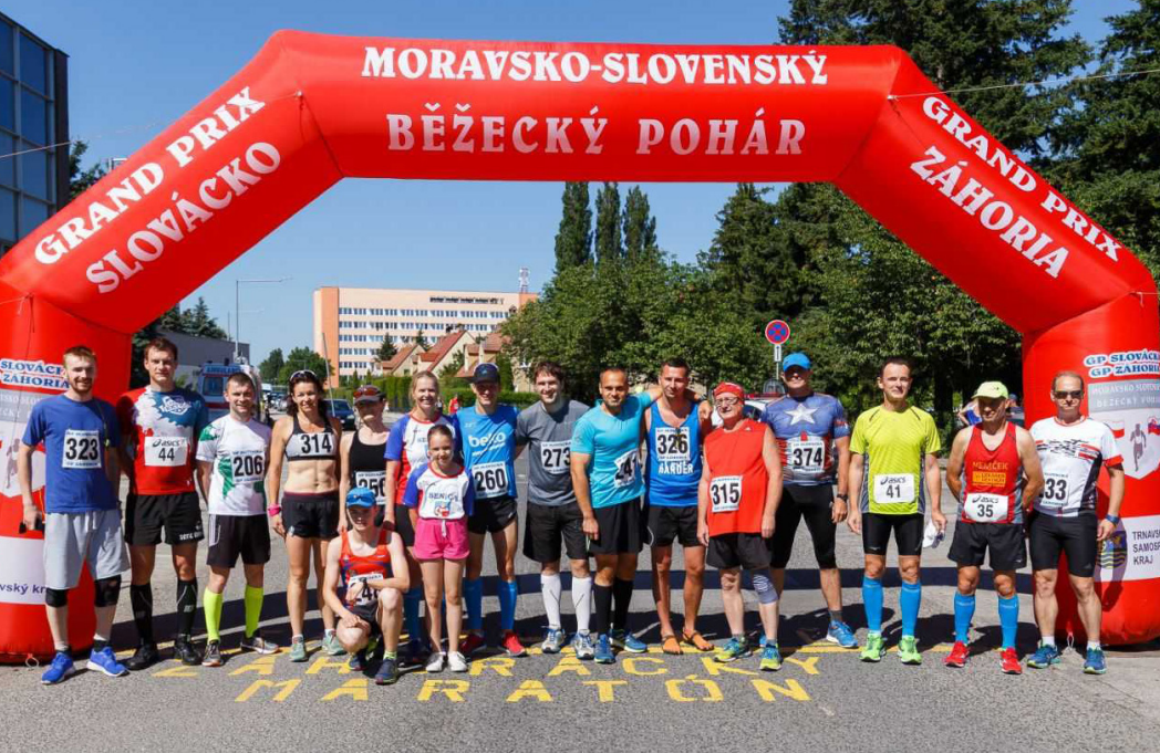
Senických pretekárov je z roka na rok čoraz viac