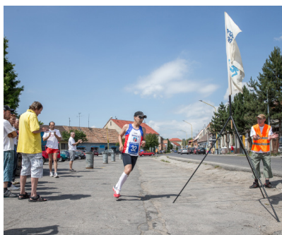
Obrátka maratónu, ktorá bola na námestí v Šaštíne – Strážach do roku 2014