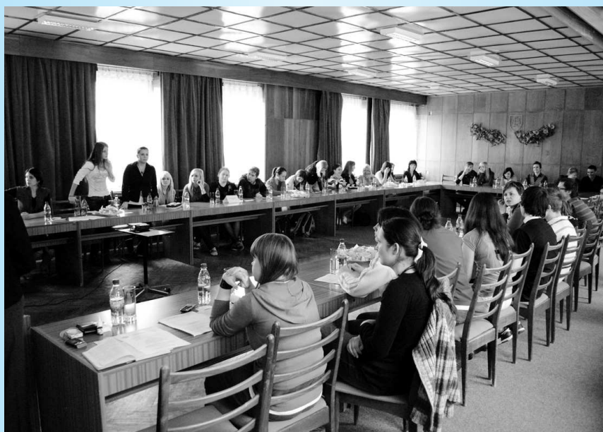
Rokovanie Študentského parlamentu.

Ostatné tri študentské rady sú oveľa mladšie, ich vznik sa datuje od septembra, resp. októbra minulého roku. Aj tak však ich činnosť je pomerne bohatá, ako zaznelo z úst ich predsedov, mimochodom veľmi dobrých rečníkov. Okrem pomoci pri tradičných školských podujatiach pripravujú i vlastné - na Strednej odbornej škole, napr. súťaž O najkrajšiu učebňu, Koncert na želanie či Vianočná pošta. Na Súkromnej strednej odbornej škole podnikania sú „v kurze“ triedne výlety a zahraničné pobyty, rada OA rieši formu rozlúčky s maturantmi a pripravuje veľký