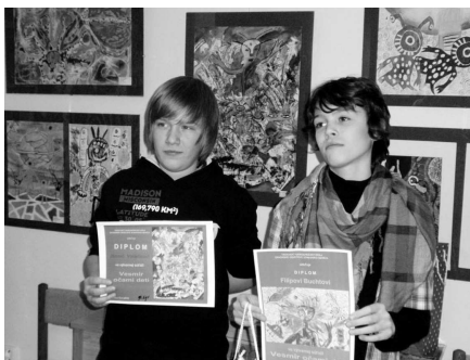
Víťazi 5. kategórie.

Porota pod vedením Štefana Ortha mohla z vystavených prác na základe kritérií vybrať 5 z každej kategórie, ktoré postupujú do celoslovenského kola a budú zaslané do Slovenskej ústrednej hviezdárne v Hurbanove. Virtuálna celoslovenská výstava bude prístupná na www.suh.sk . Regionálnu výstavu si môžete pozrieť do 9. apríla.