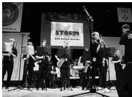
Víťazná skupina v kategórii do 19 rokov big band STORM zo ZUŠ Šaštína-Stráží.