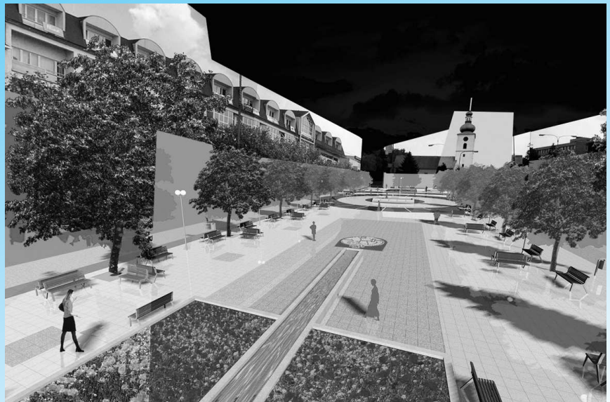
Pohľad na nové námestie od VÚB banky – zatiaľ len v polohe počítačovej grafiky. V závere leta 2011 by to mala byť skutočnosť.

Investor Mesto Senica predpokladá, že začiatok prác bude na Hurbanovej ulici . Smery chodníkov sledujú pôvodnú dopravnú líniu. (pokr. na str. 3)