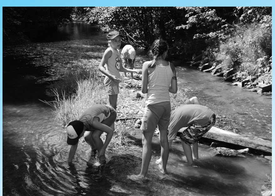
Prázdniny majú pre deti veľa podôb. Deti v tábore CVČ zachytil objektív pri ryžovaní zlata.