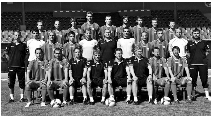
Káder FK Senica pre súťažný ročník 2010/2011.