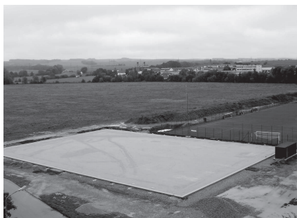
Momentálna situácia pri stavbe haly