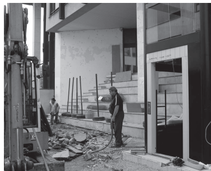
Do výťahu sa bude nastupovať v upravenom priestore od hotela Branč.

Dom kultúry sa už onedlho stane prístupný aj hendikepovaným občanom a rozšíri tak počet budov v Senici, do ktorých sa bude možné dostať bez bariér. Umožní to vonkajší výťah, ktorý je umiestnený v časti od hotela Branč. Debarierizáciu tejto kultúrnej ustanovizne určite privítajú všetci, ktorým telesný hendikep doteraz neumožňoval navštevovať podujatia kultúrneho i spoločenského rázu.