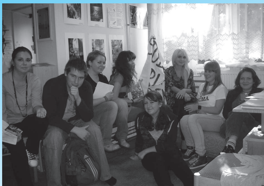
Členovia Študentského parlamentu sa pustili do práce.

Zo študentskej verejnosti opäť zaznel záujem i o fotografickú súťaž Mládež v akcii, ktorej dva ročníky sa uskutočnili pod taktovkou Študentského parlamentu. S pribúdajúcim počtom fotografických