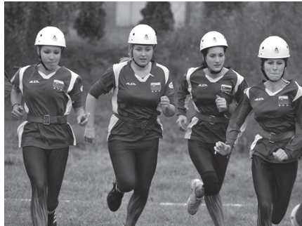
Domáce hasičky v plnom nasadení