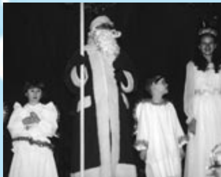
Mikuláš s anjelmi.