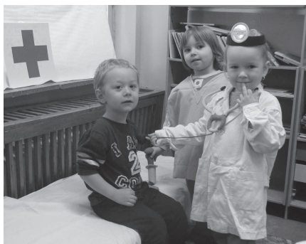
Detičky sa s radosťou zahrli na lekára a pacienta.

Hlavným cieľom projektu je formovať zdravotné uvedomenie detí a ich vzťah k podpore svojho zdravia, ochrane životného prostredia a ukázať im, aké je dôležité starať sa o svoje srdiečko. Na pomoc prišli aj študenti 3.B zo Súkromnej strednej odbornej školy podnikania, ktorým by sme touto cestou radi poďakovali za spoluprácu a veselé dopoludnie. Deti odvážili, odmerali a pomáhali im vytvárať tváričky z ovocia a zeleniny. Pomenovali sme ich Ovocníček a Zeleninka a neskôr sme si na nich pochutili.