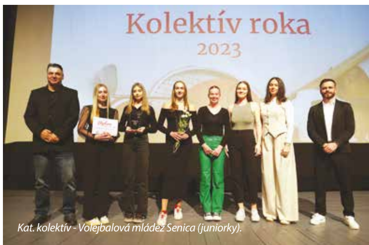
Kat. kolektív - Volejbalová mládež Senica (juniorky).