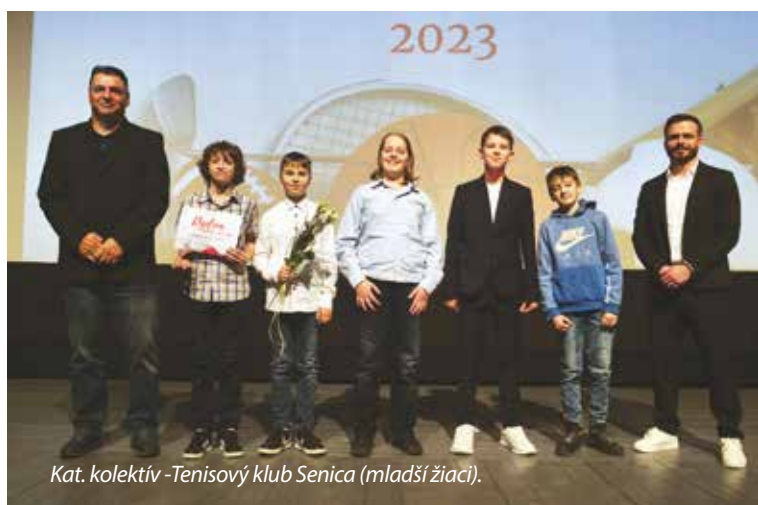
Kat. kolektív - Tenisový klub Senica (mladší žiaci).