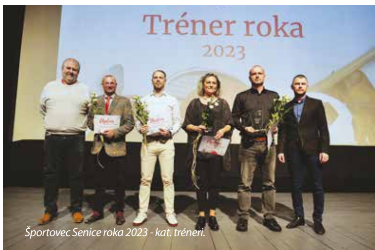
Športovec Senice roka 2023 - kat. tréneri.