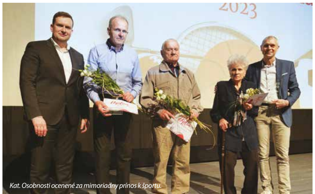
Kat. Osobnosti ocenené za mimoriadny prínos k športu.