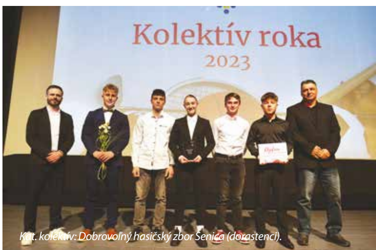
Kat. kolektív: Dobrovoľný hasičský zbor Senica (dorastenci).