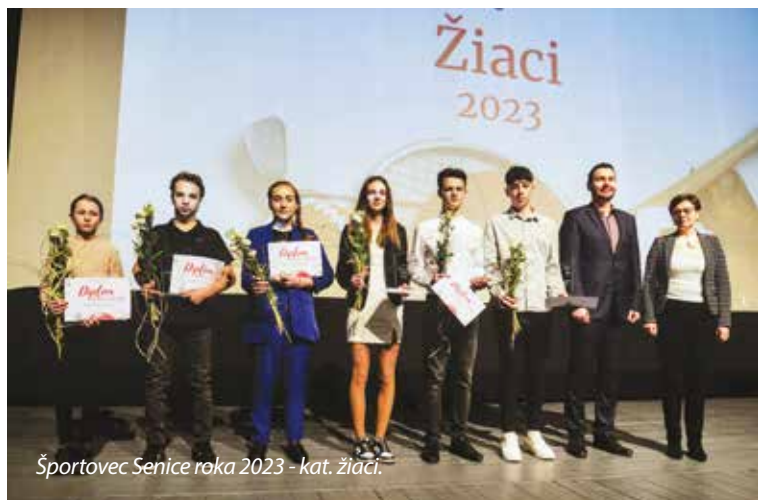
Športovec Senice roka 2023 - kat. žiaci.