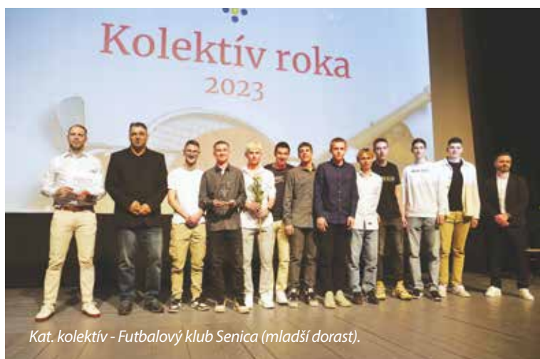
Kat. kolektív - Futbalový klub Senica (mladší dorast).