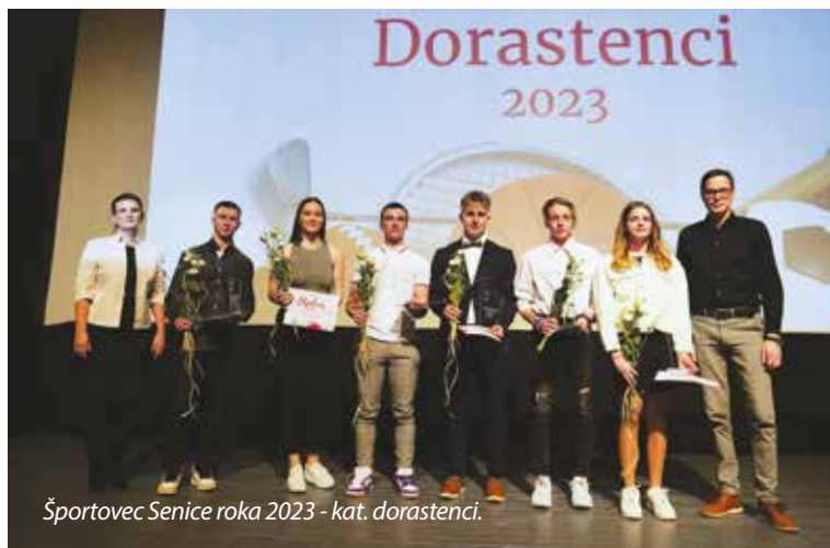
Športovec Senice roka 2023 - kat. dorastenci.