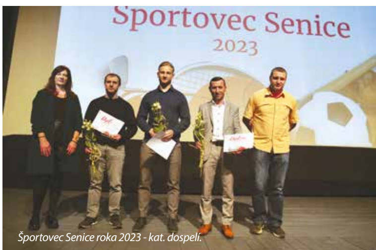
Športovec Senice roka 2023 - kat. dospelí.