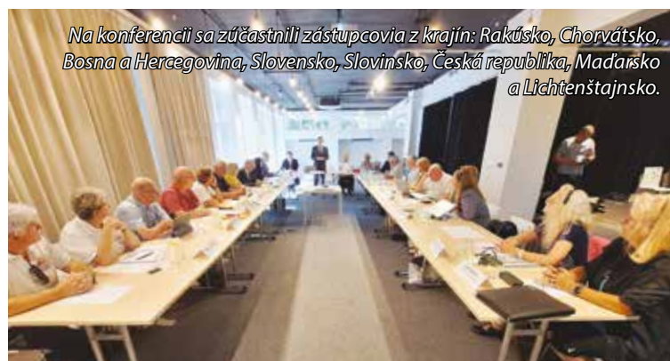
Na konferencii sa zúčastnili zástupcovia z krajín: Rakúsko, Chorvátsko, Bosna a Hercegovina, Slovensko, Slovinsko, Česká republika, Maďarsko a Lichtenštajnsko.