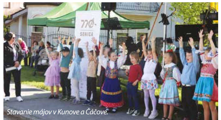
Stavanie májov v Kunove a Čáčove.