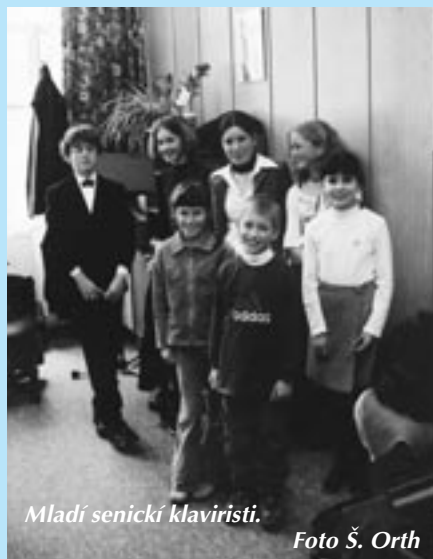
Mladí senickí klaviristi.