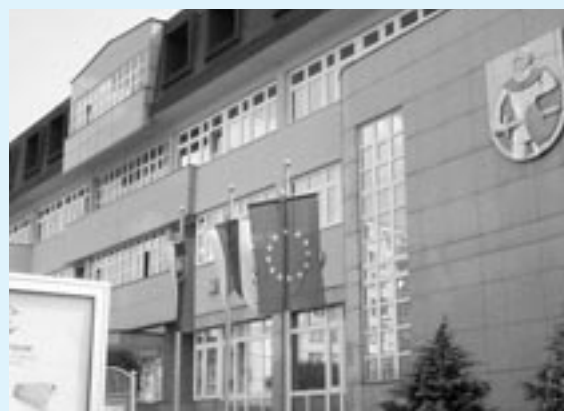
Od 1. mája je vlajka Európskej únie aj našou.

Spolu s partnerskými mestami Senice - Velkými Pavlovicami a Trutnovom v Českej republike a Pultuskom v Poľskej republike sa 1. mája stávame členmi Európskej únie.