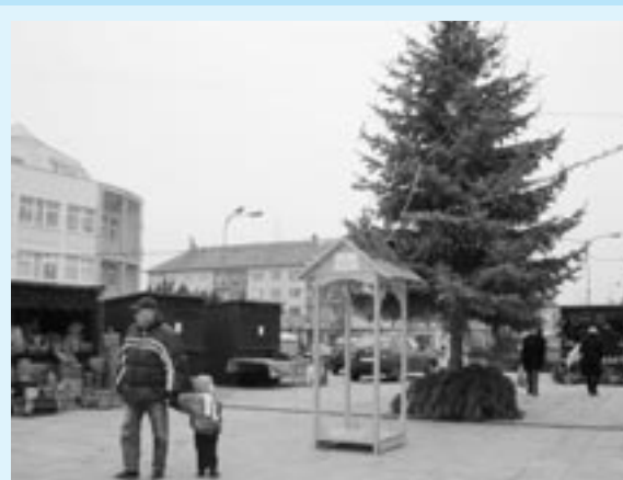
Tohtoročná výzdoba námestia prevýšila očakávania. Príjemným prekvapením je stromček hrajúci vianočné melódie.