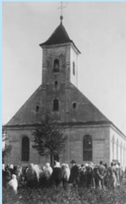
Táto fotografia evanjelického kostola je z 8. septembra 1901, kedy bola slávnostná posviacka zvonov. Zvony boli z veže kostola zrekvirované 2. októbra 1916 na vojenské ciele – boli použité na výrobu nábojov. Zo štyroch zvonov zostal iba jeden.