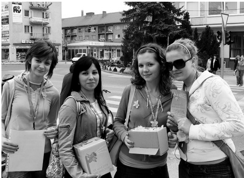
Za všetkých dobrovoľníkov, ale najmä za tých, ktorých našu pomoc potrebujú najviac, ďakujeme za štedrosť.