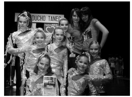
Vítazky v detskej vekovej kategórii disco dance skupina v Šali.