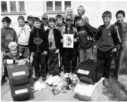
Žiaci ZŠ Mudrochova ulica: vyseparovali vyzbieraný odpad.

Napriek tomu, že Kunov začiatkom júna prežíval jedno z najťažších období, zavítali sem deti z rôznych kútov nášho okresu, aby sa zabavili, zasúťažili si, získali nové poznatky a spoznali nových kamarátov. Od 1. do 12. júna sa v Spoločenskom dome v Kunove uskutočnil už 3. ročník interaktívnej výstavy Tajomstvá života národných parkov určenej žiakom základných škôl. Výstavu malo pod patronátom Záhorské osvetové stredisko v úzkej spolupráci s Klubom Humanita a zdravie pre všetkých a Klubom priateľov Kunova.