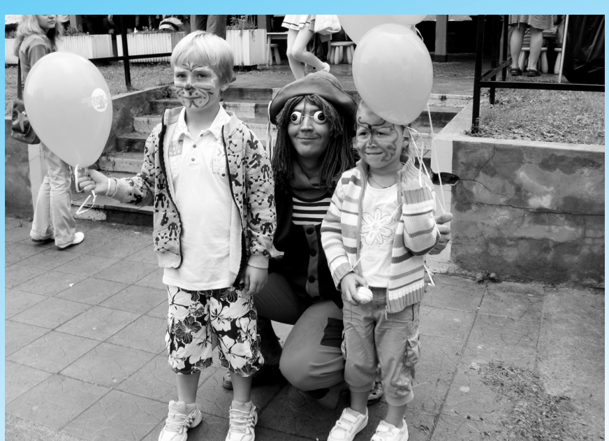
Kunovskému vodníkovi pri otváraní sezóny 27. júna aj pršalo, ale návštevníkov podujatia to neodradilo.