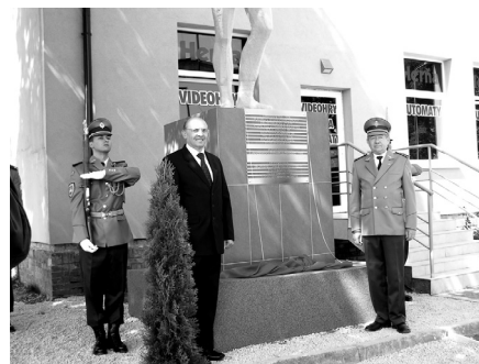
Pamätná doska na podstavci sochy bude pripomínať históriu kasární.