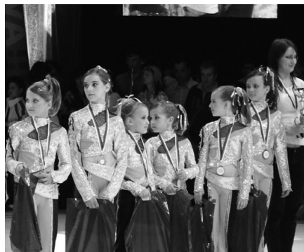
Disco skupina detská veková kategória - 2. miesto MS

V dňoch 12. - 14. júna sa v ostravskej ČEZ Aréne konali Majstrovstvá sveta a Európy International Dance Organization v disco dance a disco street show disciplínach vo všetkých vekových kategóriách. Tanečníci z 15 štátov súperili v silnej konkurencii o tie najdrahšie a najcenejšie kovy.