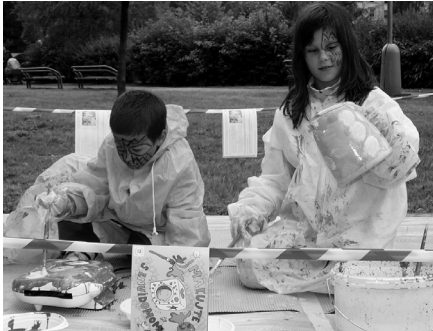
Staré spotrebiče dostávali novú tvár.

Pri príležitosti Medzinárodného dňa detí zorganizovalo Mesto Senica a Združenie pre podporu detí a mládeže v Trnavskom kraji podujatie pod názvom Deň detí a Dobrovoľníci deňom 2009. Počasie organizátorom príliš neprialo, no tí, čo prišli do Parku L. Novomeského aj napriek chladnému, zamračenému a usmoklenému počasiu, iste neolutovali.