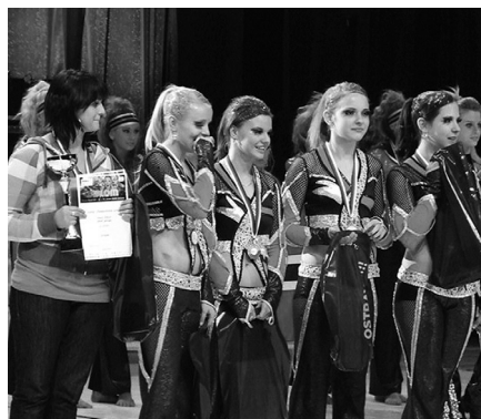
Disco skupina juniorská veková kategória - 2. miesto ME

Aj tanečníci Screamu po úspešnom nominovaní sa na MS v Senici 15. - 17. mája sa tohto šampionátu zúčastnili. Výprava so 60 tanečníkmi a 15-členným sprievodom dospelých bola vyzbrojená veľkou chuťou súťažiť. Tanečníci mali za sebou náročnú a kvalitnú prípravu... Toto sú ich umiestnenia: