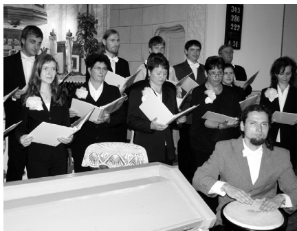
Vystúpenie spevokolu v kostole v Bielom Blate.