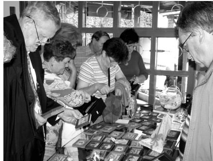
Obrázky v Galérii insitného umeni Kovačica si bolo možno aj kúpiť.