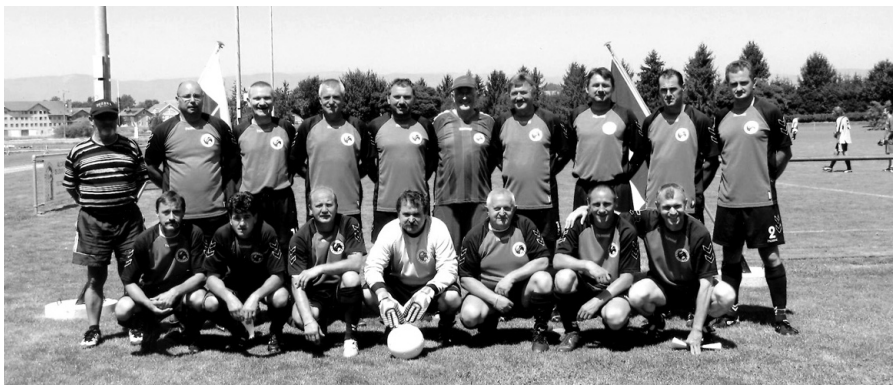
FK Senica – seniori

Tieto kultúrne a športové stretnutia majú veľký význam pre obidve strany, slovenskú aj švajčiarsku. Slúžia na poznanie mentality a kultúry našich priateľov. Športové a predovšetkým priateľské stretnutie v Corcelles bude mať pokračovanie na budúci rok v Smrdádoch. Peter Horváth