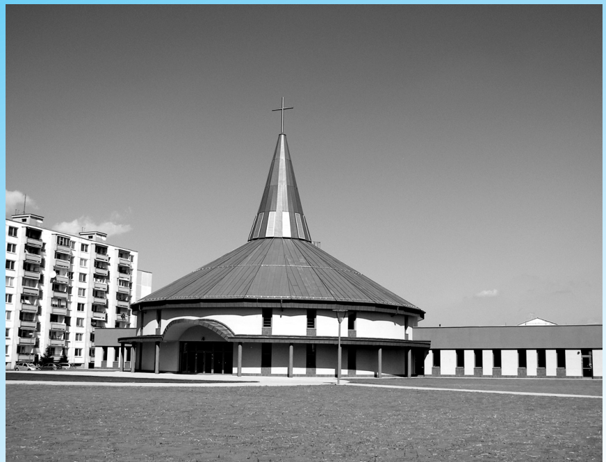
Kostol sv. Cyrila a Metoda.

Je na nás všetkých, aby tento ničím iným nenahraditeľný morálny fond slovenského národa ľahkomyseľne neskončil vedomým alebo nevedomým hodnotením histórie. Slovenské národné povstanie ako druhé najväčšie antifašistické povstanie v Európe bolo sútokom prúdov domácich aj zahraničných protifašistických síl. Sovietsky zväz poskytol SNP rozsiahlu všestrannú pomoc. Nesmieme zabudnúť ani na pomoc Povstaniu zo strany anglo-amerických spojencov. (pokr. na str. 3)