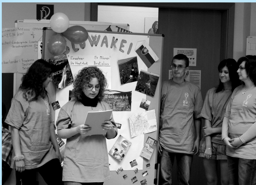
Prezentácia Slovenska a mesta Senica.

V utorok sme sa všetci zobudili dolámaní po náročnom predchádzajúcom dni a boli vďační za nenáročný program. Na pláne bola plavba po Dunaji v údolí Wachau s očarujúcou prírodou a vinicami.