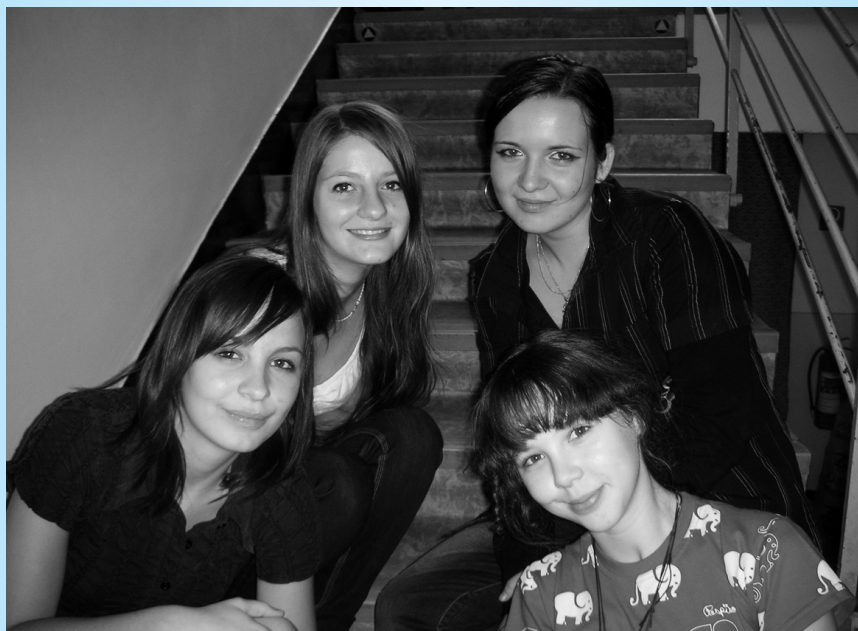
„Dievčatá z parlamentu“

Verím, že toho bude ešte oveľa viac, i šport, letná aktivita..., ale najmä to musí byť o vašej tvorivosti, o spontánnej chuti a radosti vymýšľať, organizovať či zúčastniť sa organizovaného. Čakáme teda