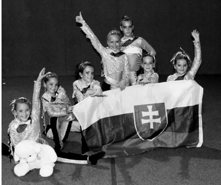
1. vicemajsterky sveta v disciplíne disco dance skupina - detská veková kategória

Bola to ťažká skúška po prázdninách, keď si tanečníci užívali zaslúžené voľno. Od 22. augusta nastúpili na sústredenie, kde skoro týždeň denne drilovali a drilovali.