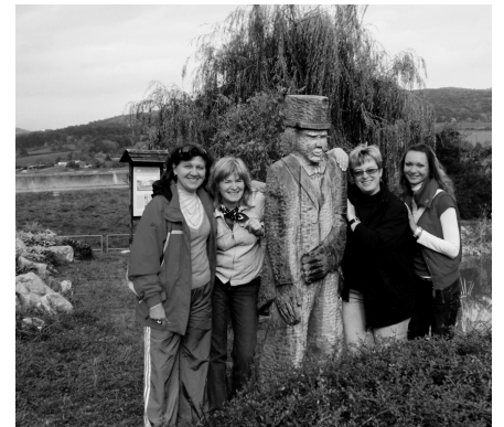
Seničanky na Teplom vrchu.

Ani XII. ročník Veľtrhu environmentálnych výukových programov ŠÍŠKA sa nezaobišiel bez účasti senických environmentalistov. Konal sa v priestoroch SEV Drieňok - Teplý vrch. Organizátorom celoslovenského podujatia bola Slovenská agentúra životného prostredia v Banskej Bystrici.