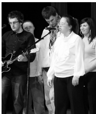
Klienti z DSS Svetluška v Kunove.