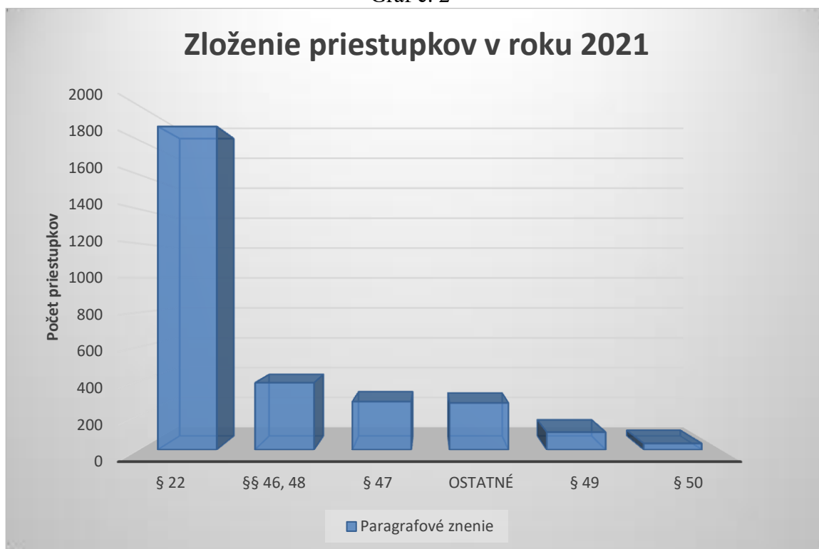
Graf č. 2

Na úseku životného prostredia bolo celkovo riešených 157 priestupkov, čo v percentuálnom vyjadrení z celkového počtu realizovaných priestupkov predstavuje podiel 5,2 %. Jednalo sa hlavne o priestupky proti poriadku v správe podľa § 46 a § 48 zákona o priestupkoch a to porušením všeobecne záväzných nariadení mesta. Do tejto kategórie patria hlavne priestupky proti verejnému poriadku podľa § 48 a to porušením VZN č. 19 – ochrana, údržba a tvorba zelene na území mesta Senice (22 priestupkov), VZN č. 21 – štatút rekreačnej oblasti Kunovská priehrada (42 priestupkov), VZN č. 64 – o nakladaní s komunálnymi odpadmi a drobnými stavebnými odpadmi (93 priestupkov), kde najčastejšie dochádza ku