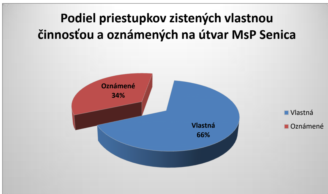
Graf č. 1

Najväčšie zastúpenie mali priestupky proti bezpečnosti a plynulosti cestnej premávky podľa § 22 Zák. č. 372/1990 Zb. o priestupkoch (ďalej len „zákon o priestupkoch“), ktorých bolo zaevidovaných 1924, čo predstavuje 64,9 % podiel z celkového počtu evidovaných priestupkov.