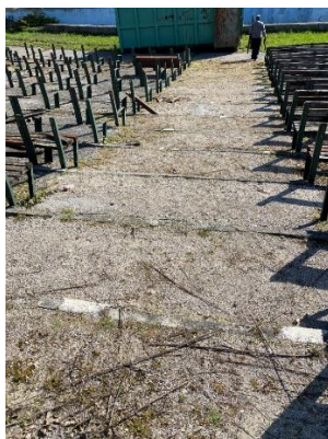
Krajné schodisko vedľa a v strede násypu