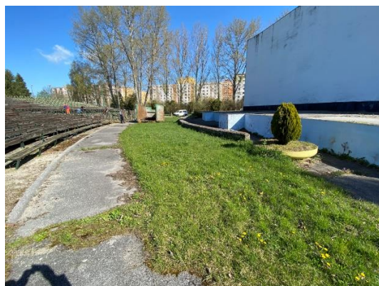
Plocha pred pódium