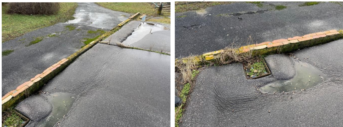
Nefunkčná vpusť pódia