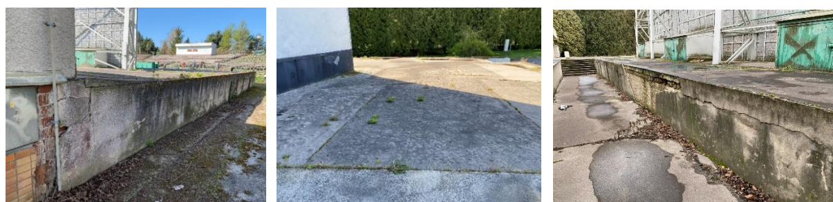
Poškodenie konštrukcie javiska