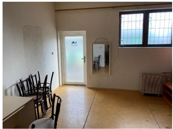
Trhliny na obvodovej stene