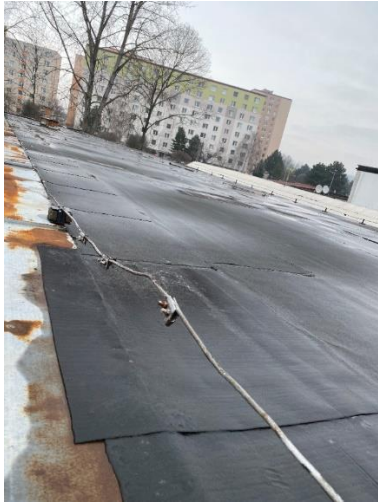
Plochá strecha prevádzkovej budovy