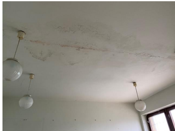
Poškodenie stropných omietok zatečením