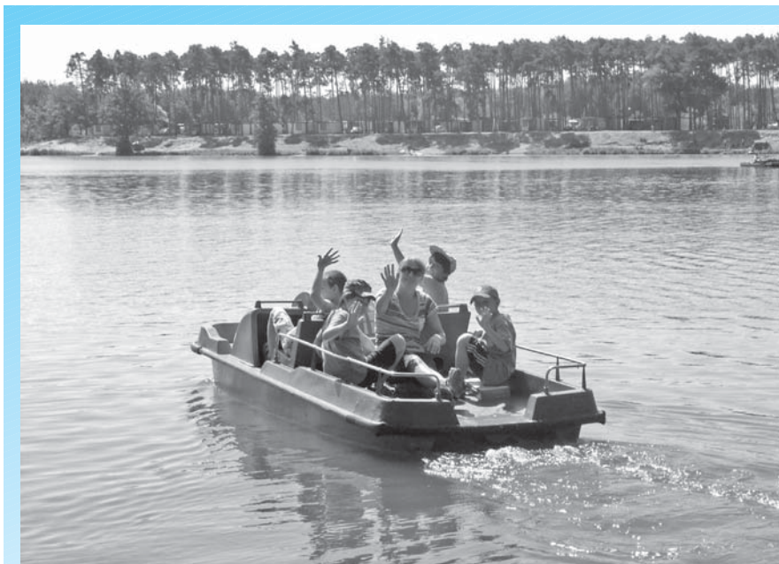
Ahoj leto, ahoj prázdniny!