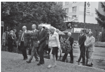
Pamiatke obetí sa poklonili predstavitelia samosprávy mesta Senica.

fašizmu zaradilo našu krajinu po vojne na stranu víťazných mocností. Dôležité v tejto dobe je nezabúdať na obeť, ktoré občania tejto krajiny priniesli vo viere v lepšiu budúcnosť všetkých nás, a preto je dôležité dôstojne si uctiť ich pamiatku.