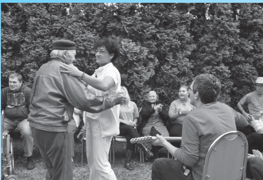
Senický týždeň dobrovoľníctva mal v zariadení soc. služieb aj takúto podobu

Možno je to len pocit, ale sú ľudia, ktorí nie lenže v DAVE v živote neboli (dokonca ani v predtým v čajovni), ale niektorí o ňom, o jeho súčasnej podobe, ani nepočuli.