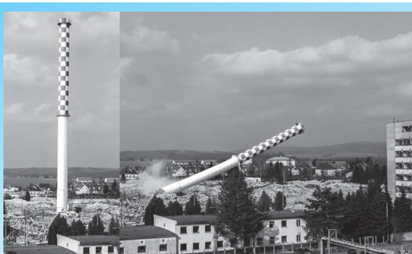
Približne 10 sekúnd trvalo, kým komín dopadol na zem.