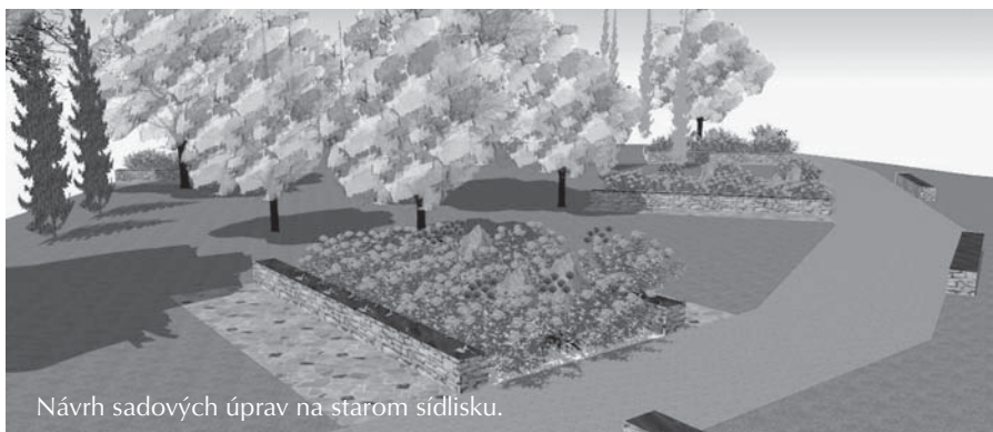
Návrh sadových úprav na starom sídlisku.

Približne 100 ľudí nájde prácu v Priemyselnej zóne Kaplinské pole v novej fabrike Najpi, a. s. zameranej na úpravu a spracovanie piesku. Vstupnú surovinu predstavuje surový piesok dovážaný z dobývacieho priestoru v Borskom Petri, ložisko Šajdíkove Humence. Kapacita technologickej linky je plánovaná 250 000 t za rok. Ložisko obsahuje takmer 75 miliónov ton piesku, jeho kvalita má najvyššiu úroveň. Vyťažený a upravený piesok má široké uplatnenie v rôznych odvetviach strojárkeho, chemického, sklárskeho a sta-