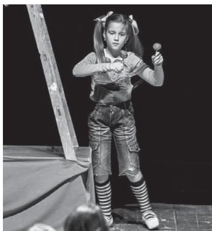
DDS Zádrapky: Božka alebo ako to možno nebolo.