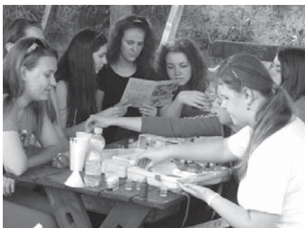
Analýza vzoriek vody z jazierok

Gymnázium Veľké Pavlovce v spolupráci s Gymnázium Ladislava Novomeského v Senici realizuje v tomto kalendárnom roku zaujímavý projekt pod názvom Poznávame prírodu – poznávame seba. V rámci neho sa uskutočnili dva pracovné workshopy, prvý v apríli a druhý 7. – 11. júla. Workshopov sa zúčastnilo vždy po 30 študentov (15 zo slovenskej a 15 z moravskej strany), dvaja lektori (z každej školy jeden) a dvaja odborní lektori z Agentúry ochrany prírody a krajiny Českej republiky.