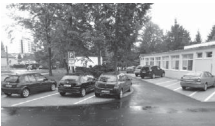
Parkovanie pri ZŠ Komenského ulica

Mesto Senica je zriaďovateľom základných škôl, Materskej školy L. Novomeského, Základnej umeleckej školy a Centra voľného času. Všetky školy a školské zariadenia využili leto na údržbu, generálne upratovanie a modernizáciu. Niektoré práce financovalo mesto Senica, niektoré školy zo svojich zdrojov.