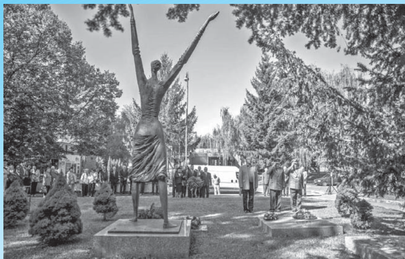
70. výročie SNP bolo príležitosťou na prejavenie úcty obetiam, ale aj na upevnenie národnej hrdosti, že patríme do rodiny národov, ktoré bojovali proti fašizmu a porazili ho.