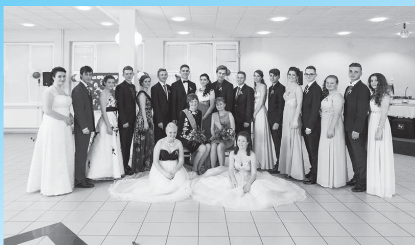
Stužková slávnosť 4. CR z Obchodnej akadémie Senica.