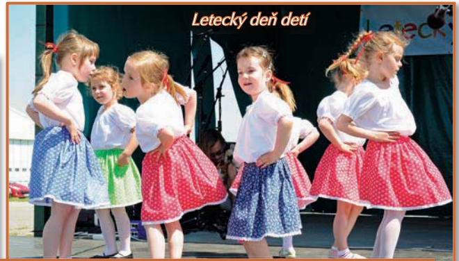
Letecký deň detí