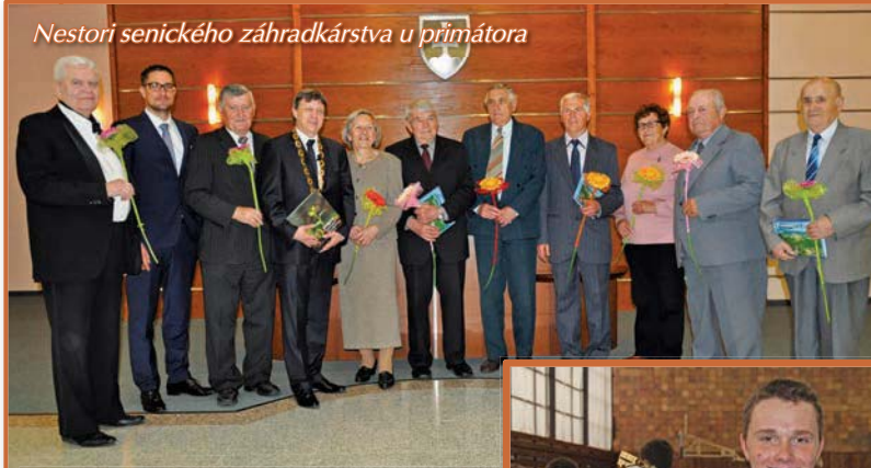
Nestori senického záhradkárstva u primátora