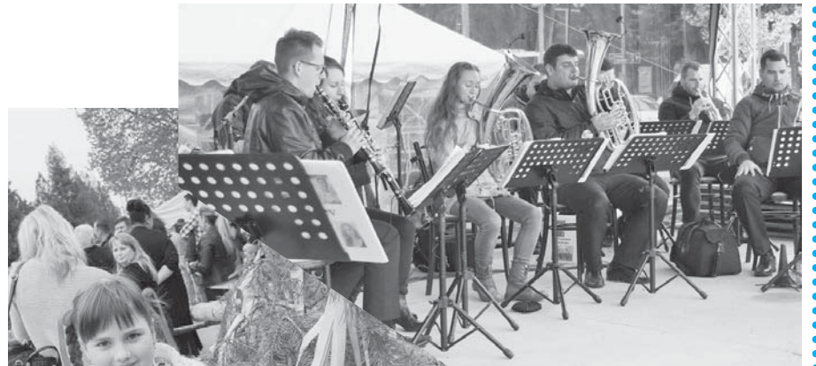
Stavanie mája v Senici, Čáčove a Kunove