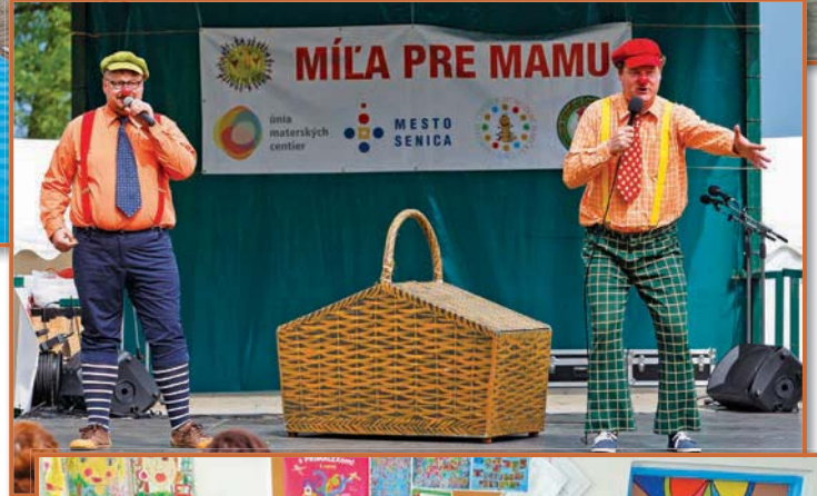
MÍLA PRE MAMU