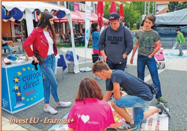
Invest EU - Erazmus+