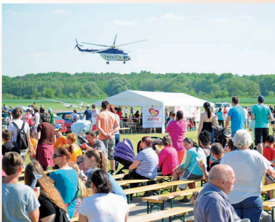
Na leteckom dni detí sme za hojnej účasti malých i veľkých oslávili ich sviatok.

Do jednotlivých rajónov sú pridelení títo policajti, (Pokračovanie na str. 3)