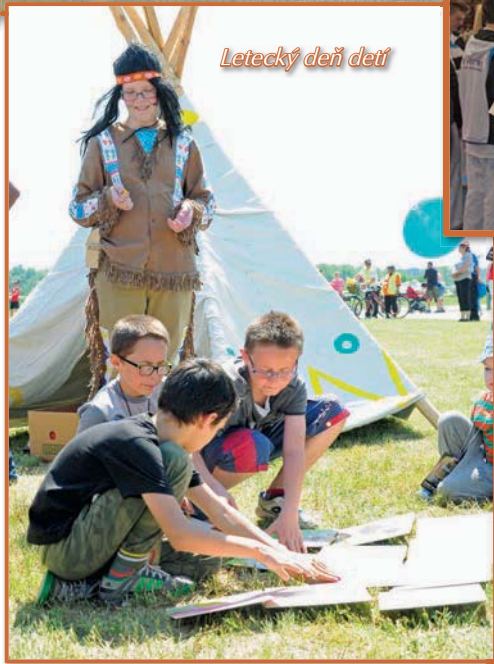
Letecký deň detí