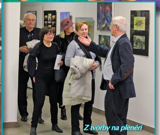
Z tvorby na plenéri