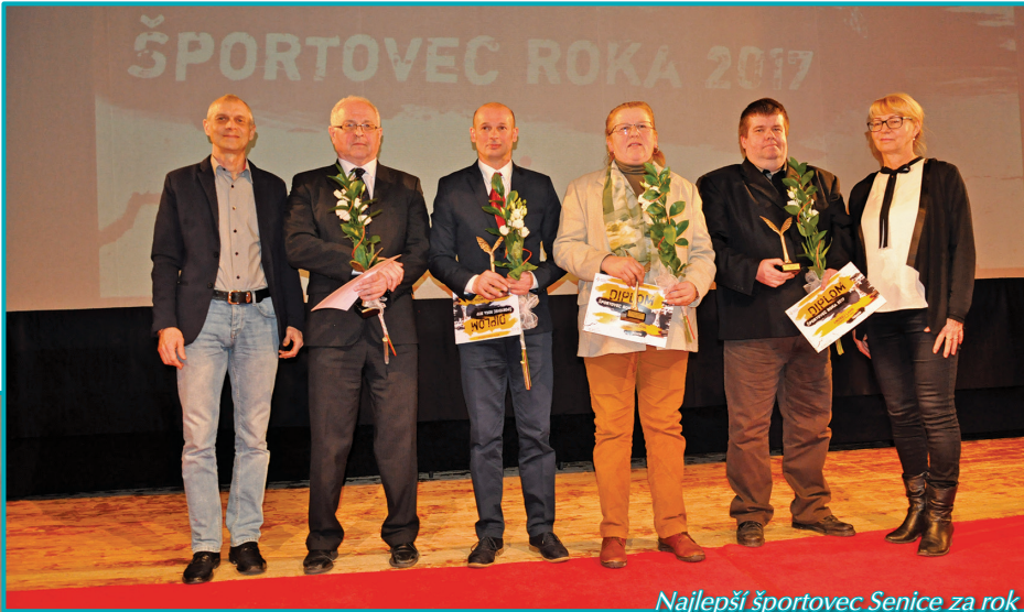
Najlepší športovec Senice za rok 2017