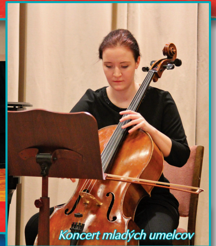
Koncert mladých umelcov