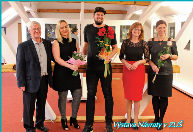
Výstava Návraty v ZUŠ