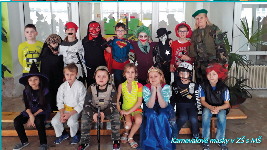
Karnevalové masky v ZŠ s MŠ