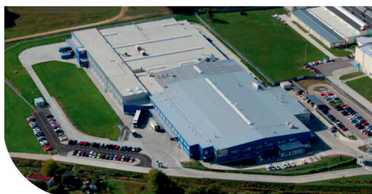
Honeywell | Elster Stará Turá