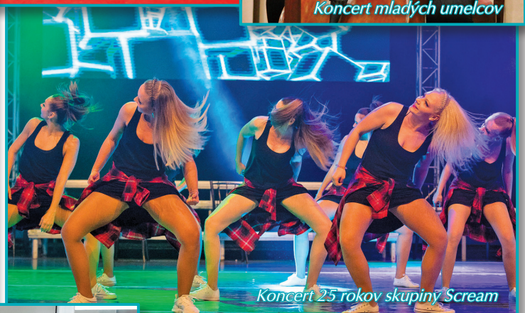
Koncert 25 rokov skupiny Scream