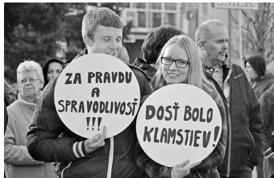
text a foto lv

Niekoľko stoviek Seničanov prišlo v pondelok 12. marca vyjadriť svoj názor na Námestie oslobodenia počas občianskeho zhromaždenia Za slušné Slovensko. Zhromaždenia v iných mestách sa konali v piatok 9. marca, no pondelňajší termín si organizátori v Senici nevybrali náhodou. Kým sa na jednej strane senického námestia konal protest, v dome kultúry, vzdialenom len pár metrov od námestia, prebiehali oslavy MDŽ organizované politickou stranou SMER-SD. „Považujeme za absolútne nezhodné v čase morálnej krízy Slovenska organizovať oslavy akéhokoľvek sviatku a tváriť sa, že sa nič nestalo. V žiadnom prípade to nie je namierené voči ženám a ich sviatku MDŽ, ale oslavy vládnej strany Smer - SD sú nemorálne,“ uviedli v pozvánke na zhromaždenie jeho organizátori.