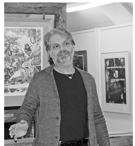
text a foto Štefan Orth