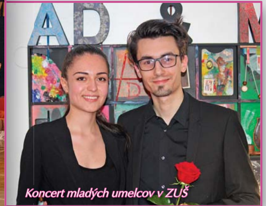
Koncert mladých umelcov v ZUŠ