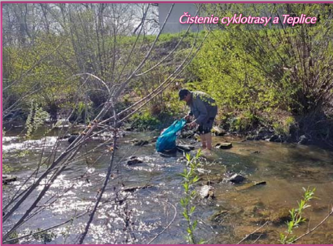
Čistenie cyklotrasy a Teplice