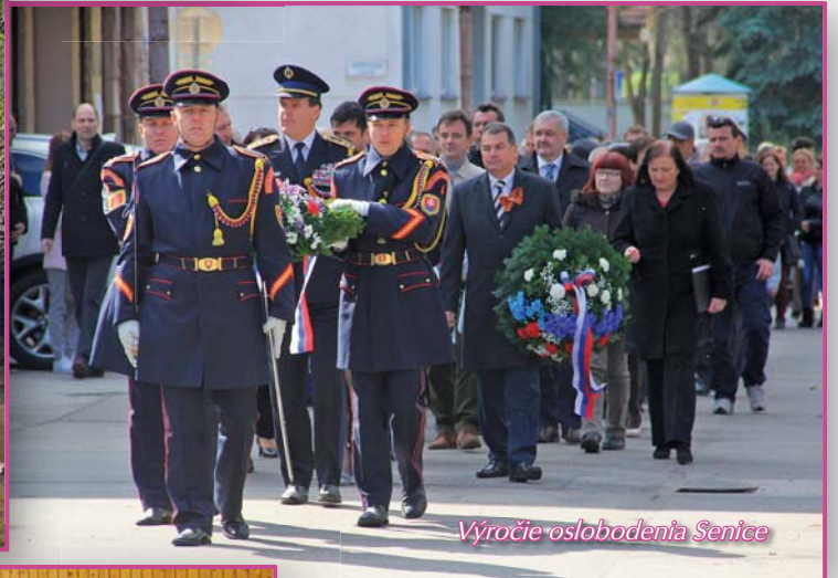
Výročie oslobodenia Senice