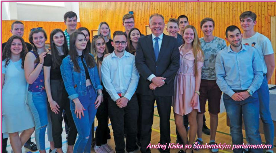
Andrej Kiska so Študentským parlamentom