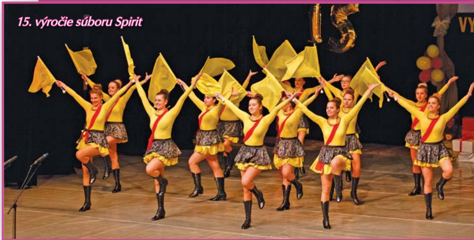
15. výročie súboru Spirit