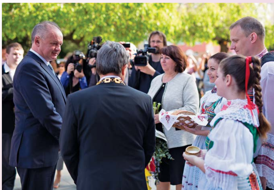
Privítanie prezidenta SR Andreja Kisku pred senickou radnicou.

S predstaviteľmi samosprávy mesta prezident diskutoval o investičnom rozvoji a živote v meste i o aktuálnych problémoch, ktoré trápia obyvateľov.