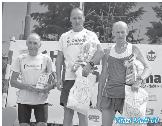
Víťazi Muži 60