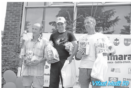
Víťazi Muži 50