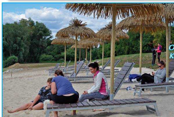
Otvorenie sezóny na Kunovskej priehrade