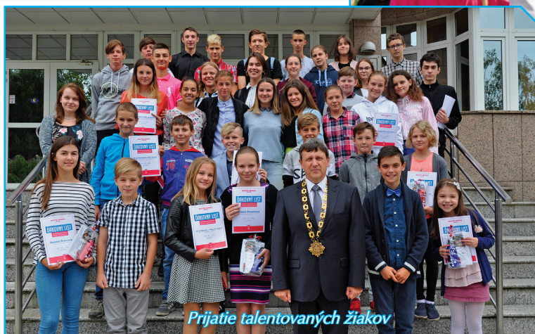
Prijatie talentovaných žiakov