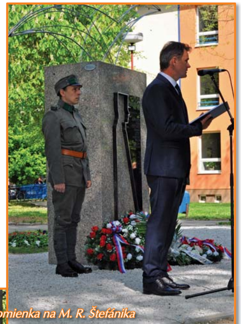
Spomienka na M. R. Štefánika