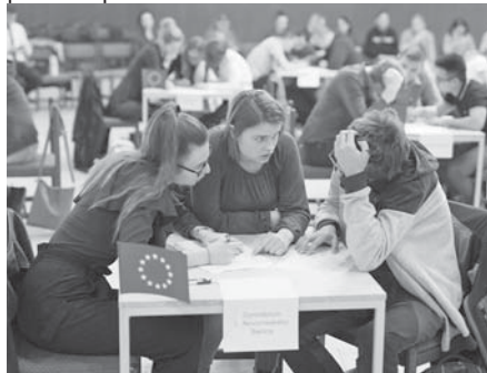
Družstvo Gymnázia L. Novomeského.

V Dome kultúry v Senici sa 3. apríla uskutočnil 14. ročník vedomostnej súťaže Mladý Európan. Súťaž pozostávala z testu o Európskej únii, jazykovej krížovky a obrázkového kvízu. Prioritami regionálnej súťaže Mladý Európan pre tento rok boli voľby do Európskeho parlamentu, 15. výročie vstupu SR do EÚ, 10. výročie prijatia spoločnej meny euro a Investičný plán pre Európu.