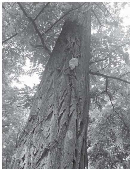
Drevokazná huba strom poškodzuje.