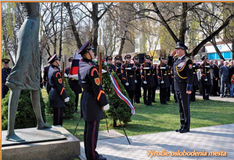
Výročie oslobodenia mesta