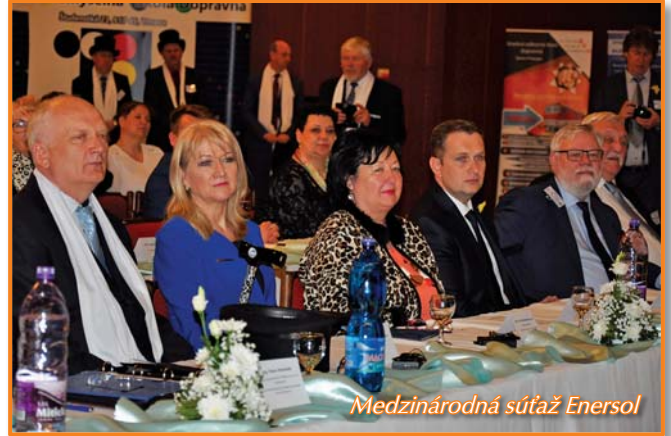
Medzinárodná súťaž Enersol