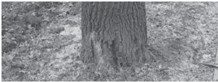
Poškodený strom musel byť odstránený.