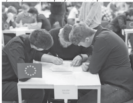
Družstvo SSOŠP Senica.