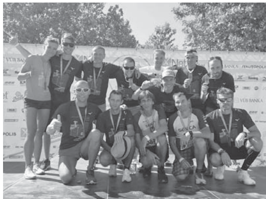
ZFT v cieľi na Tyršovom nábřeží v Bratislave.

Tento rok bol náš tím zložený opäť internacionálne z atléto, ktorí pravidelne absolvujú Moravsko-Slovenský bežecký pohár ale bol aj posilnený dvomi triatletmi.