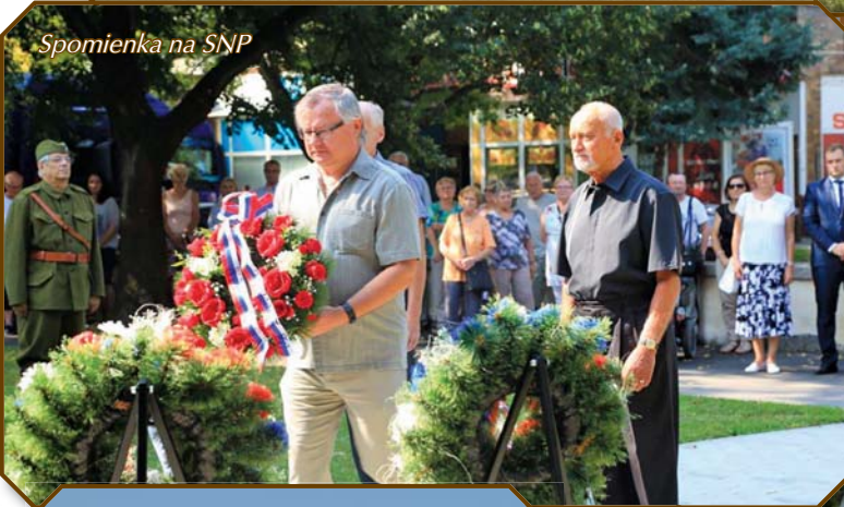
Spomienka na SNP