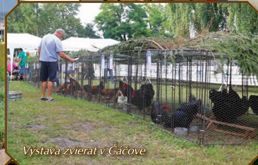
Výstava zvierat v Čáčove