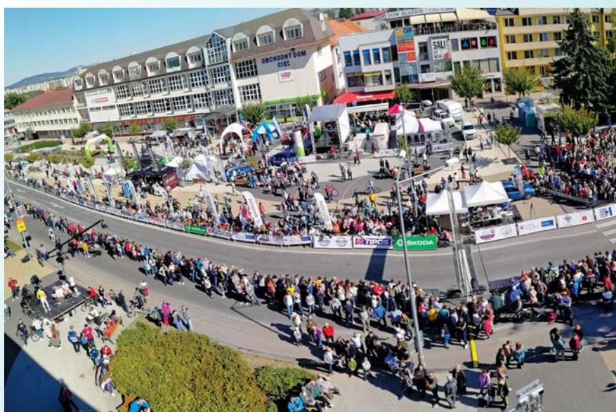
Pohľad na námestie počas pretekov Okolo Slovenska.