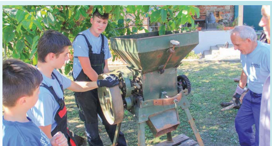
Počas Senického týždňa dobrovoľníctva mladí pomáhali aj pri čistení exponátov v Škodáčkovom mlyne v Čáčove.

Predsedníčka študentskej rady, od r. 2017 aj predsedníčka Študentského parla-