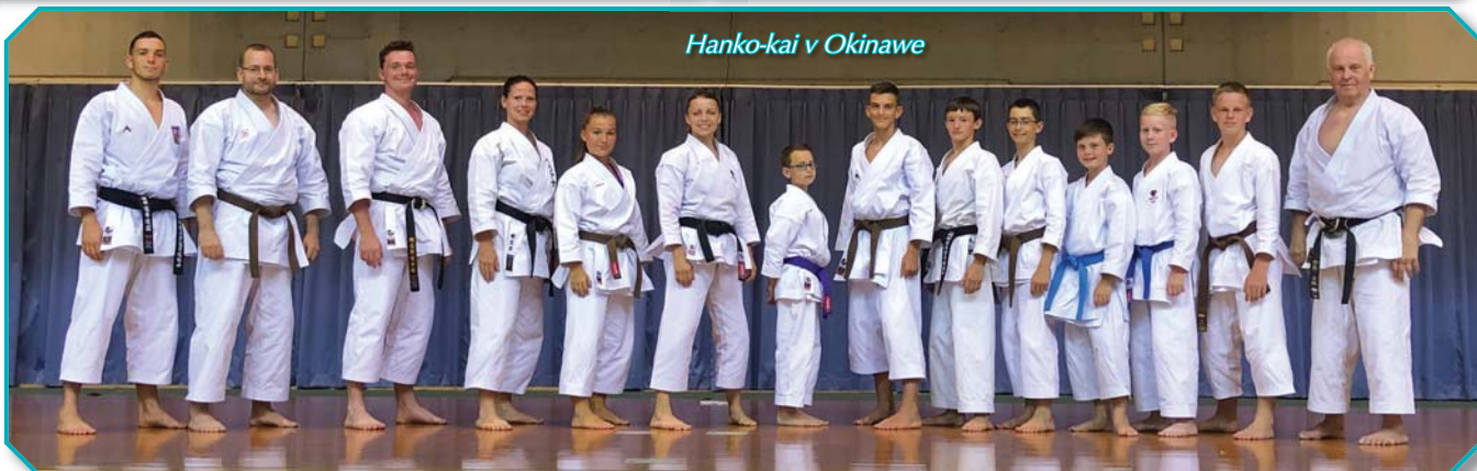
Hanko-kai v Okinawe