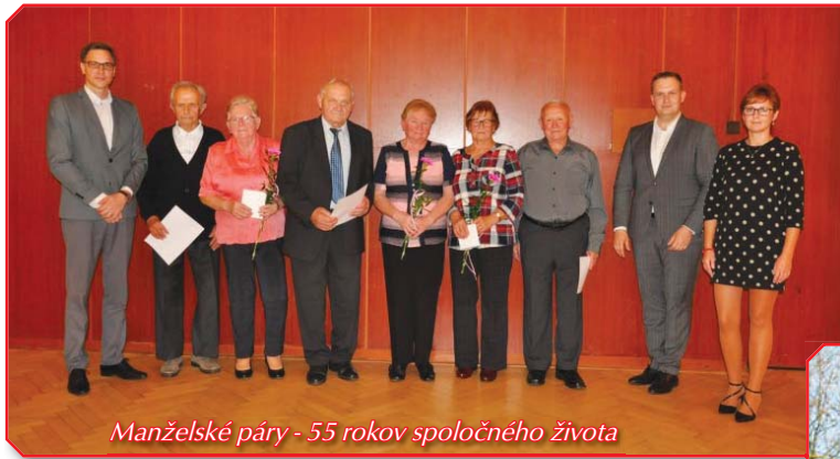
Manželské páry - 55 rokov spoločného života