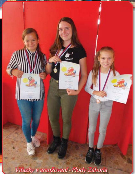
Víťazky v aranžovaní - Plody Záhoria