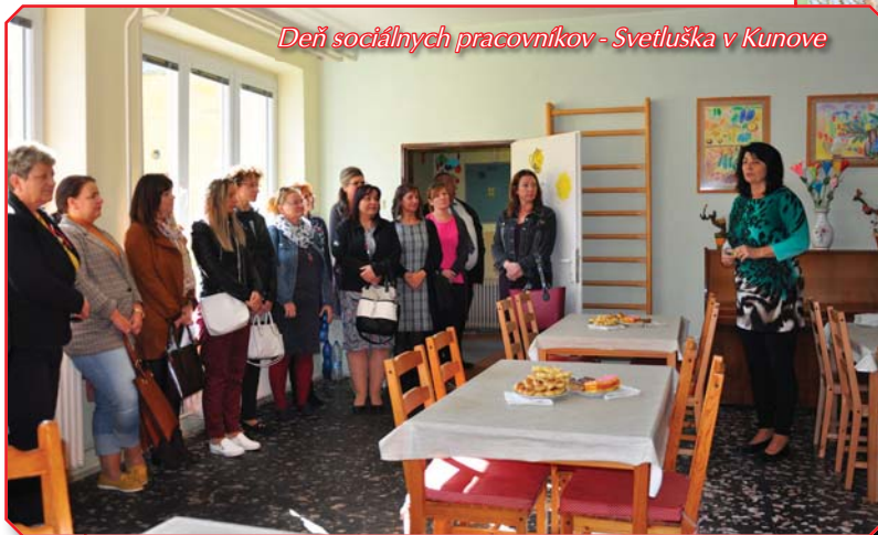
Deň sociálnych pracovníkov - Svetluška v Kunove