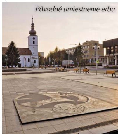
Pôvodné umiestnenie erbu

S a m o s p r á v u mesta viedli k premiestneniu viaceré dôvody, pretože symbol mesta by sme mali mať v rovnakej úcte a vážnosti ako štátne symboly. Erb bol umiestnený v strede námestia niekoľko centimetrov nad úrovňou dlažby a spôsobil nejednu pádu, keď ľudia oň zakopli. Mnohí po ňom chodili, bol terčom skejstov, čo možno považovať za jeho znevažovanie. Na ploche námestia bol umiestnený od 11. novembra 2011, kedy sa oficiálne dalo Námestie oslobodenia po rozsiahlej rekonštrukcii do užívania. Napriek spomínaným problémom sa počas 5-ročnej doby udržateľnosti projektu s erbom nedalo hýbať. Až tohto roku nové vedenie samosprávy po rokovaniach s projektantom námestia a zvažovaní viacerých lokalít erbu patróna mesta premiestnili na dôstojné miesto.