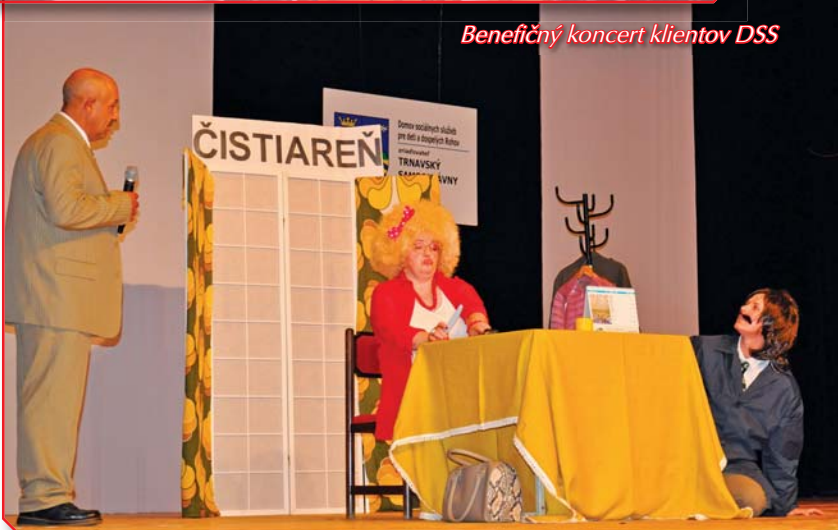
Benefičný koncert klientov DSS