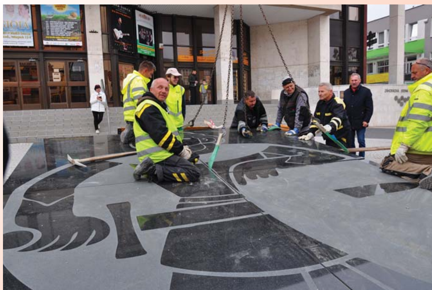
Posledná fáza premiestňovania - štvrtý diel erbu mesta zapadol na svoje miesto.