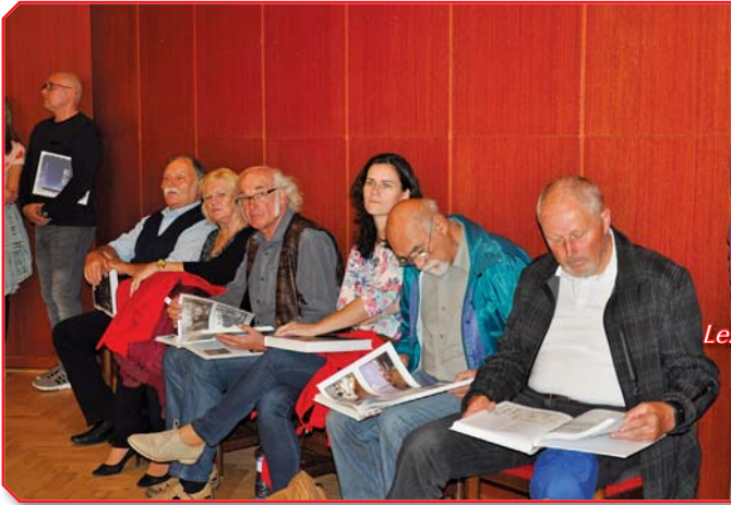
Lesk a mat hodvábu