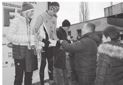
Víťazi hlavnej kategórie muži