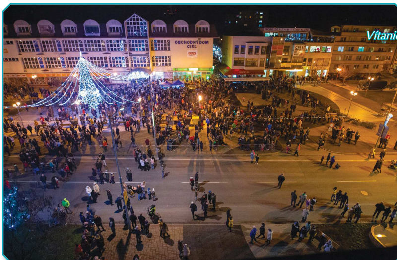
Vítanie nového roka