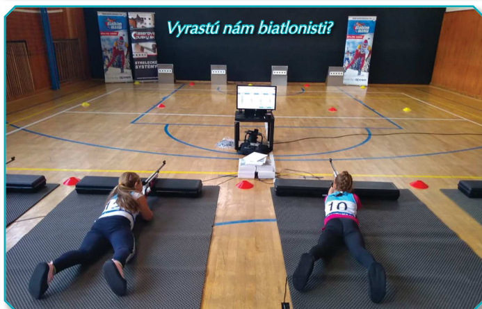
Vyrastú nám biatlonisti?