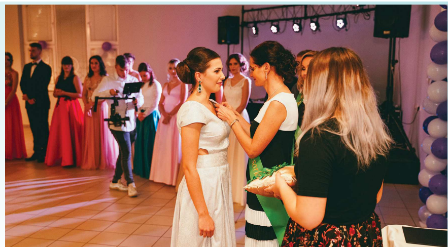
Zelená stužka pre maturantov 4.A Obchodnej akadémie, predzvesť vstupu do dospelosti.

Ako som tento večer prežívala ja? Chvela som sa, slzy som mala na krajíčku. Kým prišla tá očakávaná chvíľa šerpovania, poďakovali sme sa rodičom a profesorom za starostlivosť, lásku a zaspomínali si na naše študentské začiatky. Zaspomínali sme si na to, keď sme prekročili prah strednej školy s nervozitou, ako sme spoznali nových ľudí a ako začali vznikať aj prvé lásky. Uvedomili sme si, že už nie sme malé deti s rozbitými kolenami a vstupujeme do sveta dospelých. Po dlhom, ale veľmi príjemnom státi pri prijímaní zelených stužiek,