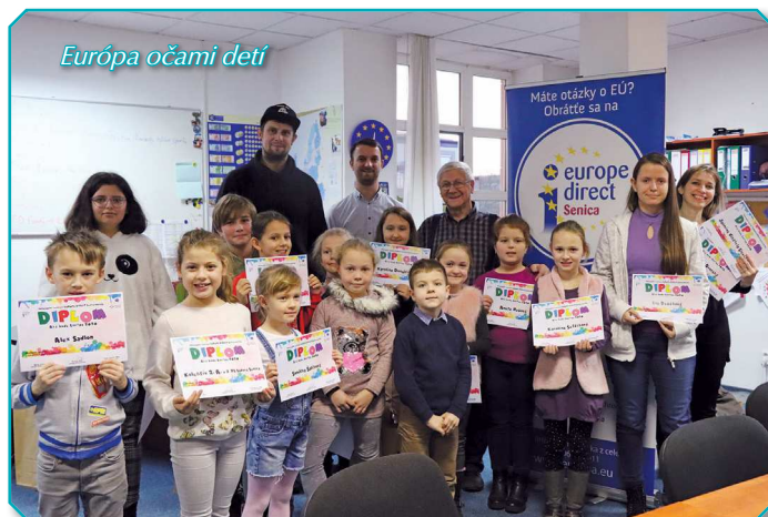
Európa očami detí