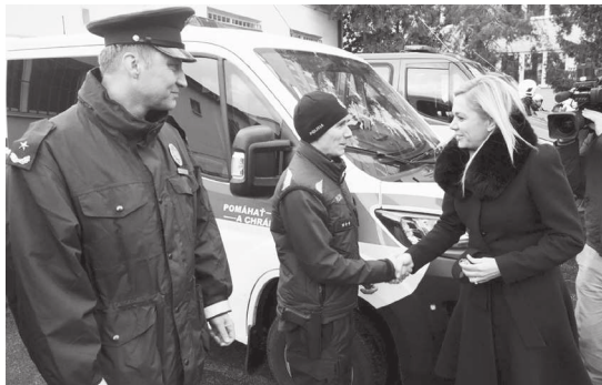
lv foto: zdroj MV SR

Prvozásahového auto Iveco Daily zas prevzali zástupcovia