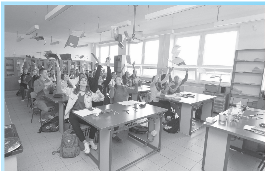
Hádzanie zošitov v 4. B Gymnázia L. Novomeského