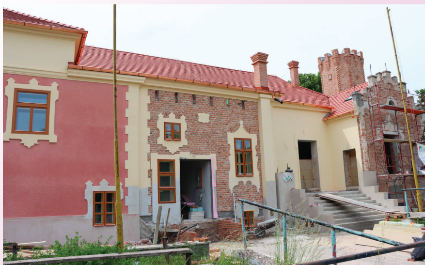
Budova Sokolovne nadobúda pôvodné kontúry letohrádku z čias statkára Vagýona.