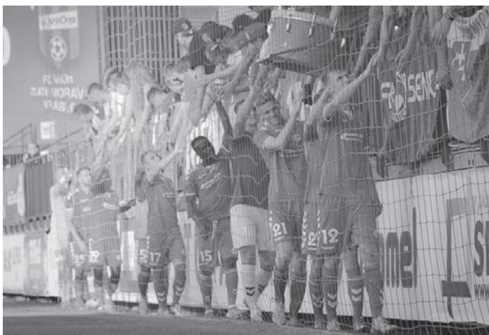
Ateam - Seničania sa po zápase so Zl. Moravcami rozlúčili aj so svojimi fanúšikmi.