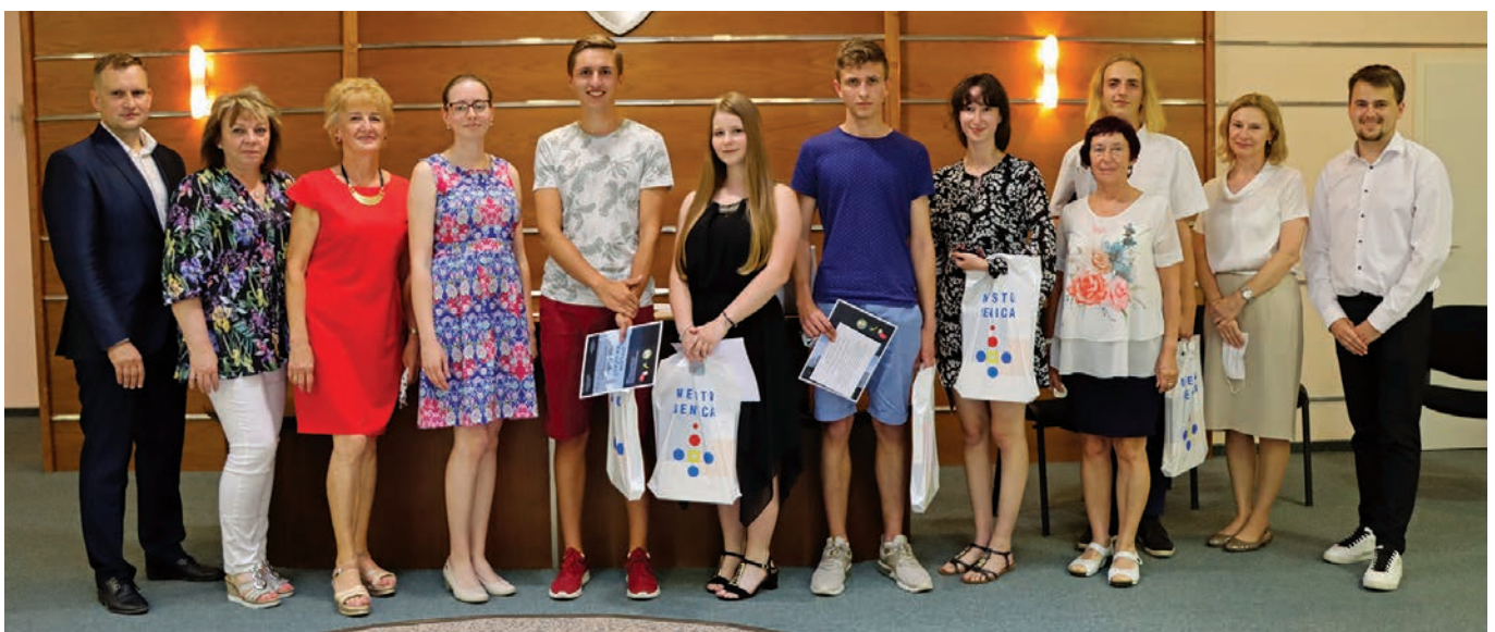
Súťažiaci druhej kategórie, 17- až 19-roční študenti.