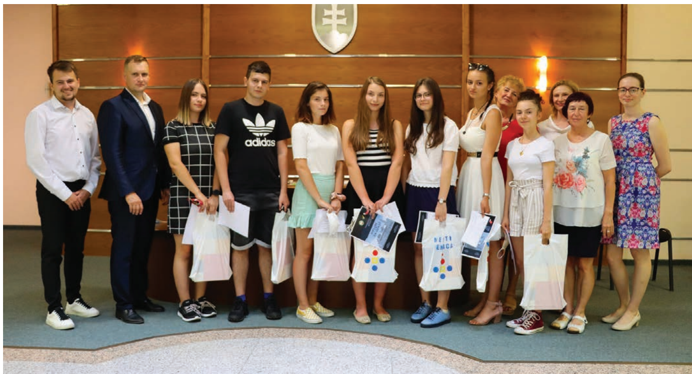
Súťažiaci prvej kategórie, 14- až 16-roční študenti.