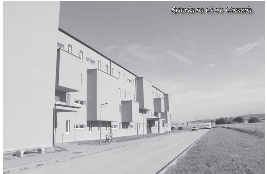
Bytovka na Ul. Sv. Gorazda.