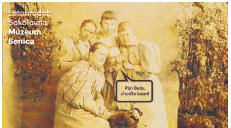
Pri príležitosti slávnostného ukončenia cezhraničného projektu, vďaka ktorému je Senica bohatšia o mestské múzeum, bola vydaná séria špeciálnych pohľadníc.