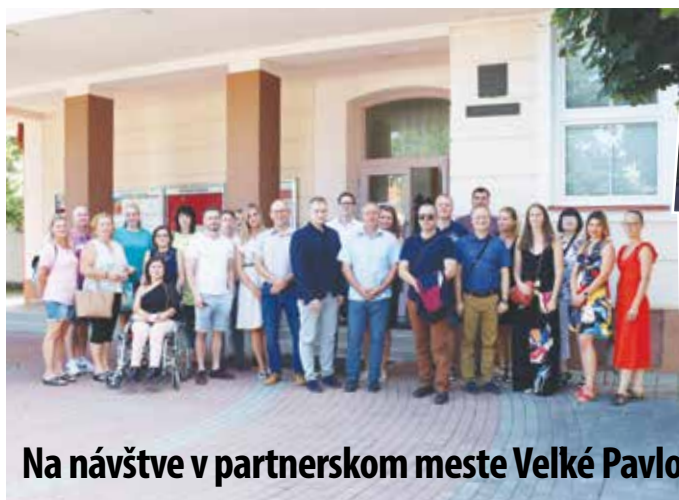
Na návšteve v partnerskom meste Velké Pavlovice

poznajú len z filmov, komiksov a obrázkov. Keď sa deti opýtate, či poznajú nejakého hrdinu, odpovedia, že Spidermana alebo Ironmana... na hrdinstvo tých, čo nám vybojovali slobodu sa zabúda. Čím ďalej sme od tejto udalosti, čím menej je veteránov a primých účastníkov, tým je táto udalosť blejšia a upadá do zabudnutia. A to prináša do nášho života znovuobjavovanie sa fašistických organizácií. Preto to? Je to i naša chyba, že nevieme deťom priblížiť históriu a učiť ich vážiť si slobodu a demokraciu. Spomienky na hrdinov blednú a nám sa nad hlavami zelenajú zástavy s dvojkřížom... Napĺňa sa výrok, že človek čo nepozná svoju históriu bude nútený ju znovu prežiť. A to nesmieme dopustiť. Nesmieme dopustiť, aby museli naše deti znovu robiť povstania, aby si uchovali slobodu a demokraciu. Dosť už bolo násilia, agresie, zlovoľe a vojny. S pohľadom upretým na pamätník si musíme aj my tu sľúbiť, že ochránime našu vlasť a deti pred nebezpečenstvom fašizmu a vojny. -red-