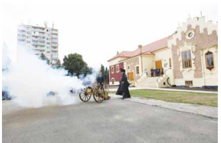
V 19. storočí (keď vo svojom letohrádku žil veľkostatkár Vagyón) sa významné udalosti oslavovali salvou z dela, ktorú na slávnostnom podujatí odpálil primátor.

Snahou Mesta Senica bolo vytvoriť modernú expozíciu so všetkými technologickými vymoženosťami, ktorá svojou interaktívnosťou zaujme všetky generácie, no najmä mladých ľudí. Ide o kontaktné múzeum, kde návštevník nie je len pasívnym poslucháčom, ale do získavania informácií je priamo vtiahnutý. Informácie o expozíciách získava aj dotykom, niekto-