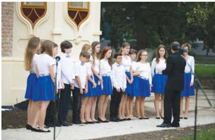
Na úvod slávnostného podujatia zaznela slovenská hymna vo verzii "Dobrovoľnícka" z roku 1844 v podaní speváckeho zboru ZUŠ Senica.

ré z exponátov si pomocou pohybu svojich rúk prezerá zväčšené vo virtuálnej priestore, volí si typ informácií, ktoré chce získať.