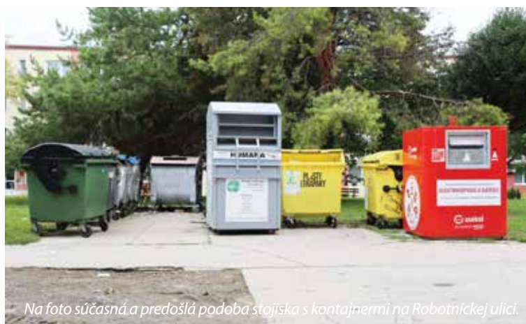
Na foto súčasná a predošlá podoba stojiska s kontajnermi na Robotníckej ulici.