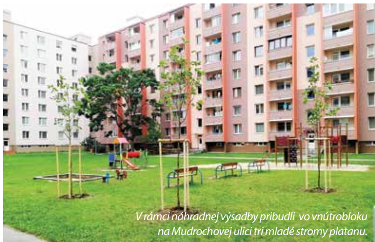
V rámci náhradnej výsadby pribudli vo vnútrobloku na Mudrochovej ulici tri mladé stromy platanu.

Ak je žiadateľovi povolený výrub stromu, v rozhodnutí mu je nariadená náhradná výsadba. Určuje sa počet náhradných drevín, druh dreviny, miesto výsadby a termín, dokedy má byť náhradná výsadba zrealizovaná.