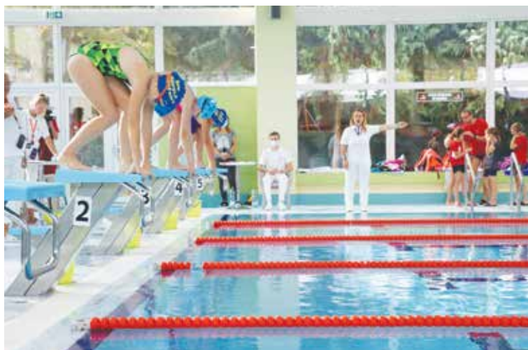
Septembrového Slovenského plaveckého pohára žiakov západoslovenskej oblasti sa v Senici zúčastnilo 88 pretekárov z trinástich klubov.

Aj touto cestou dodatočne gratulujeme a želáme veľa ďalších osobných rekordov a úspechov. Vzhľadom na opatrenia z dôvodu Covidu tieto naozaj pekné výkony nemohli vidieť rodičia, ani starí rodičia a kamaráti. V každom prípade tieto mladé nádeje plávania si zaslúžia náš obdiv a dodatočný potlesk.