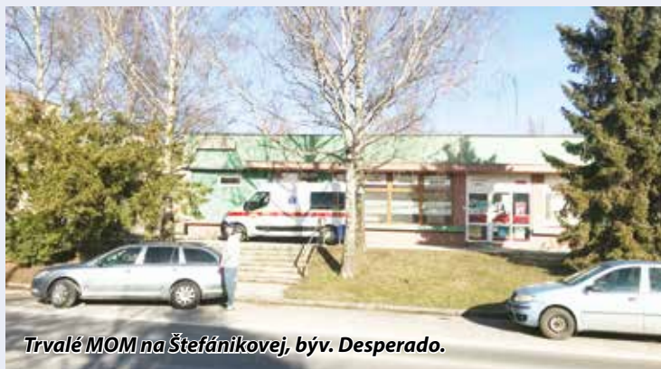
Trvalé MOM na Štefánikovej, býv. Desperado.