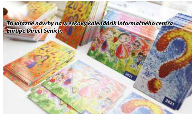
Tri víťazné návrhy na vreckový kalendárik Informačného centra Europe Direct Senica.