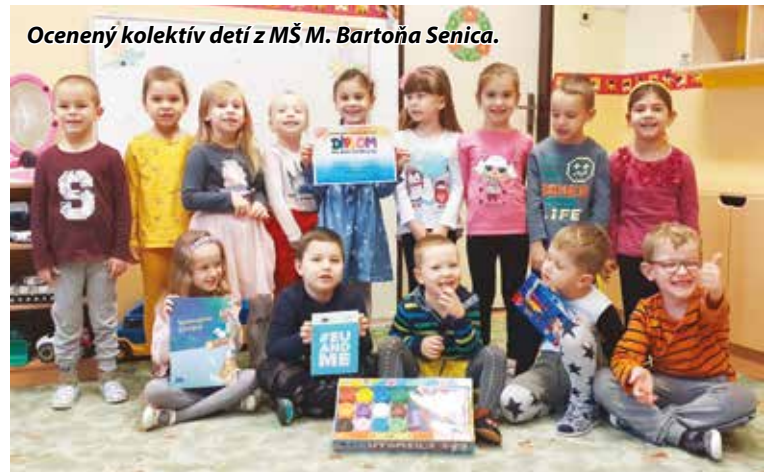
Ocenený kolektív detí z MŠ M. Bartoša Senica.

Výtvarná súťaž je vždy plná pozitívnych očakávaní a predstáv na nasledujúci rok, z ktorej sa môže inšpiro-