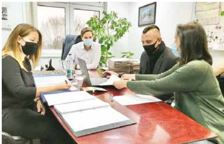
Pracovné stretnutie so zástupcami Regionálneho centra sociálnej ekonomiky (RCSE) so sídlom v Trnave, ktoré má vo svojej činnosti agendu sociálnych podnikov.