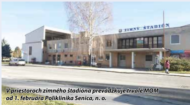
V priestoroch zimného štadióna prevádzkuje trvalé MOM od 1. februára Poliklinika Senica, n. o.