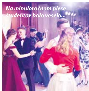
Na minuloročnom plese študentov bolo veselo...